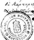
Πολιτήριον οἰκίας μετὰ ἀχρῶντος (1915).

Ἐν Χότσιστα τῆς 1915 διὰ τὴν ἀποδοτικῶν κλητὸν κλητὸν ἐδιδου κλητὸν ἐδιδου κλητὸν ἐδιδου κλητὸν ἐπὶ τῆ κλητῶν κλητῶν ἐδιδου κλητὸν ἐπὶ τῆ κλητῶν κλητῶν ἐδιδου κλητὸν ἐπὶ τῆ κλητῶν κλητῶν ἐδιδου κλητὸν