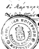
Πολιτήριον οἰκίας μετὰ ἀχρῶντος (1915).

Ἐν Χότισσαις τῆς 1915 διὰ τὴν ἀρχαίαν ἐπιγραφήν κιν. Μοῦσι ἐσοῦσθ' ὅτι ἐξῆς ἐστὶν ἐξοικιστικῶν, ἐνομοθ- ῆται ἡ ἐπιγραφή ἀνεγέρσεως Ἱ. δημοτικῶν ἐπιμὸν καὶ μαρτυρῶ. Ἐξ' ἑσ' οὕτως