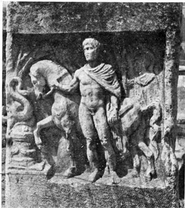
δ. Δεξιά πλευρά βωμού 44.