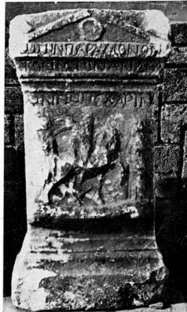
β. Πρόσοψη βωμού 82.