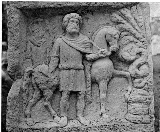
α. Πίσω πλευρά βωμού 44.