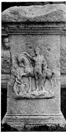
β. Πρόσοψη βωμού 47.