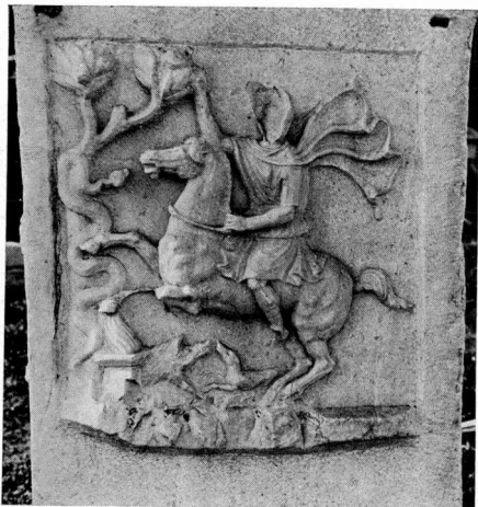
β. Δεξιά πλευρά του βωμού 46.