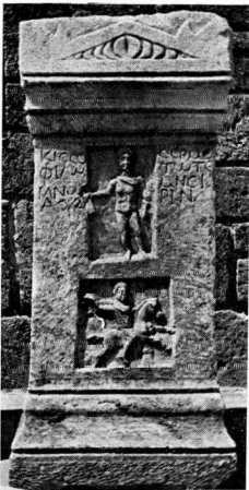
α. Πρόσοψη βωμού 61.