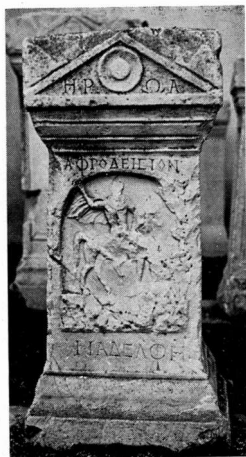
α. Πρόσοψη βωμού 48.