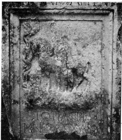
γ. Πρόσοψη βωμού στο τείχος.