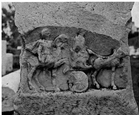
β. Πίσω όψη βωμού 47.