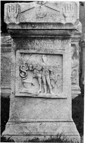
γ. Πρόσοψη βωμού 44.