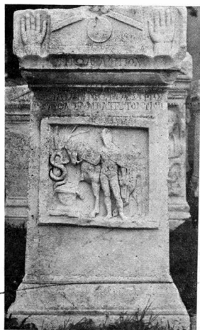
γ. Πρόσοψη βωμού 44.