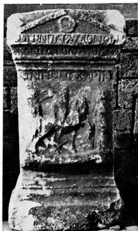
β. Πρόσοψη βωμού 82.