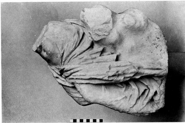
α. 'Αγαλμα S 1530 Αρχαίας Αγοράς Αθηνών. Πλάγια αριστερή πλευρά.