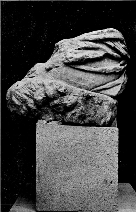
Ἄγαλμα αρ. ΓΛ 11 Μουσείον Πέλλας. Ἡ πίσω πλενρά.