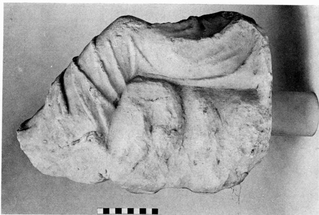
β. 'Αγαλμα S 1530 Αρχαίας Αγοράς Αθηνών. Πλάγια δεξιά πλευρά.