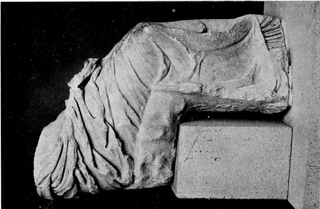
α. 'Αγαλμα αρ. ΓΛΙΙ Μουσείου Πέλλας. Πλάγια δεξιή πλευρά.