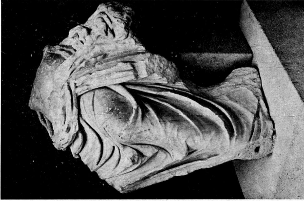
β. Ἀγάλμα αἰ. ΓΑΙΙ Μουσειῶν Πελέας. Κόρυα ὄψη.