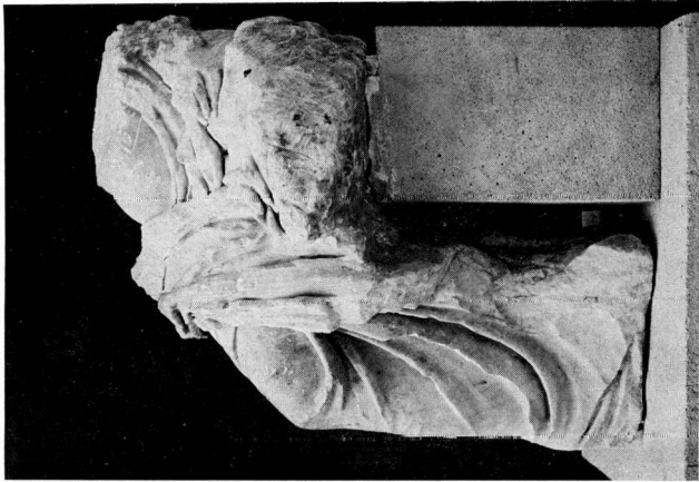
β. 'Αγαλμα αρ. ΓΛΙΙ Μουσείου Πέλλας. Πλάγια αιώστειρή πλένυρά.