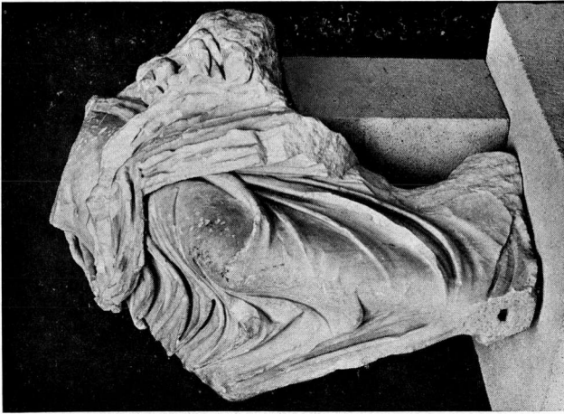
α. Ἀγάλμα αἰ. ΓΑΙΙ Μουσειῶν Πελέας. Κόρυα ὄψη.