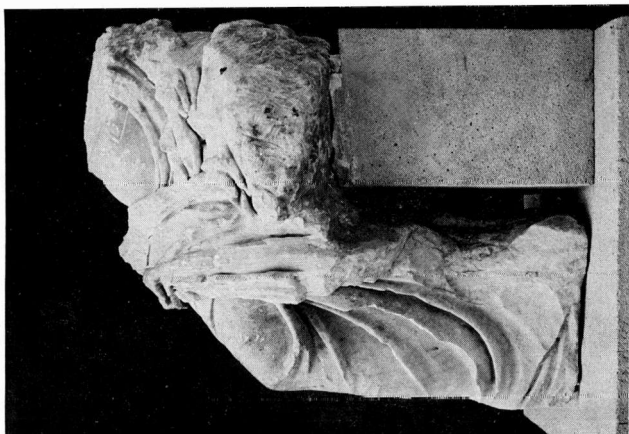
β. 'Αγαλμα αρ. ΓΛΙΙ Μουσείου Πέλλας. Πλάγια αιώστειρή πλένυρά.