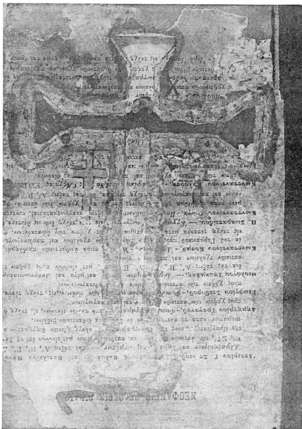
Εικ. 4. Ὁ κατάλογος Νεοφανῶν ἐκδόσεων βιβλίων.