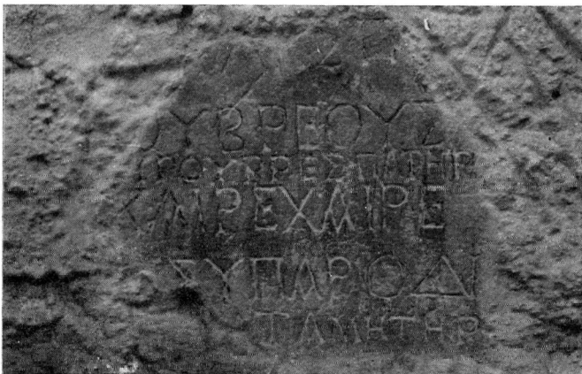
Η ανεπίγραφη πλάκα από το «Ζηλί» που είναι σήμερα εντοιχισμένη σε σπίτι του χωριού Χρυσός (Σερρών)

Ιδιαίτερο ενδιαφέρον, τόσο για την ιστορία της ελληνικής γλώσσας όσο και για την ανθρωπωνυμολογία, παρουσιάζει το όνομα Πυρουβρες , που φέρει ο πατέρας του νεκρού. Για την ιστορία της ελληνικής γλώσσας το ενδιαφέρον βρίσκεται στην κατάληξη του ονόματος. Συγκεκριμένα από τη γενική πτώση του ονόματος (Πυρουβρεους) που μας παραδόθηκε στο δεύτερο στίχο της επιγραφής, διαπιστώνει κανείς ότι η ονομαστική του κανο-