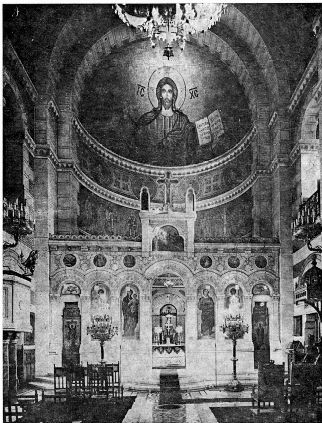
Εικ. 1. Τὸ ἐσωτερικὸ τῆς ἐλληνικῆς ὀρθοδόξου ἐκκλησίας τοῦ Ἁγ. Στεφάνου Παρισίων, ὅπως εἶναι σήμερα