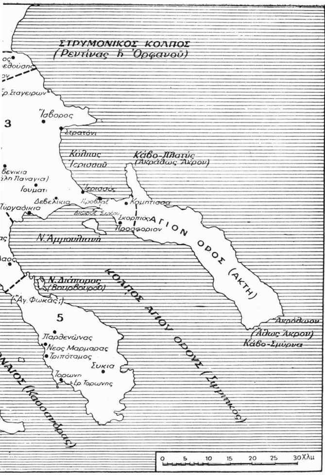
τον Καλαμαρίας, ἀριθ. 1