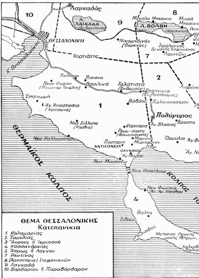
Σχέδ. 1. Τὰ ὅρια τοῦ κατεπα...