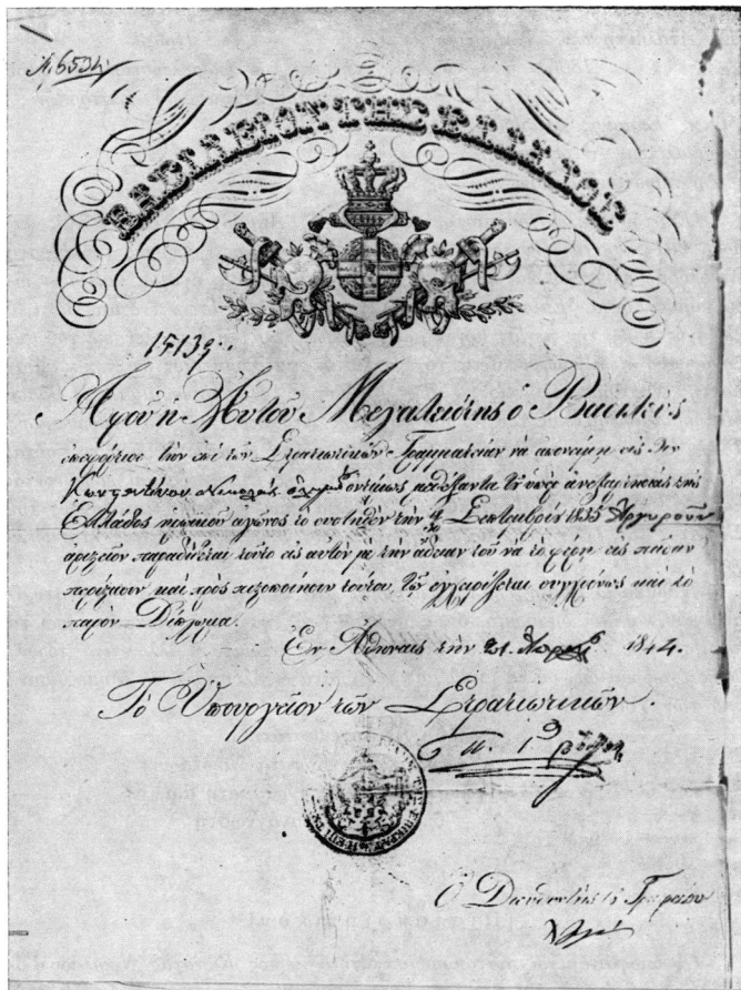
Εικ. 1. Τὸ ἀργυρὸ ἀριστεῖο ἀντρείας τοῦ Κώστα Νικολάου-Όλυμπίου