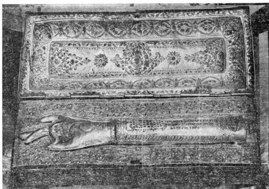
Εἰκ. 2. Τεμάχιον λειψάνου τοῦ ἐκ τῶν Πεντεκαίδεκα Ἱερομαρτύρων Πέτρου (Αὐτόθι, σ.60)

Σήμερον, μετὰ δηλαδὴ τοὺς δύο βαλκανικοὺς καὶ τοὺς δύο παγκοσμίου πολέμους τοῦ αἰῶνος μας, ὅποτε ὁ χάρτης τῆς Χερσονήσου τοῦ Αἴμου ἔχει διαφοροποιηθῆ πολιτειακῶς καὶ δημογραφικῶς, ἄγομεν νέαν περίοδον