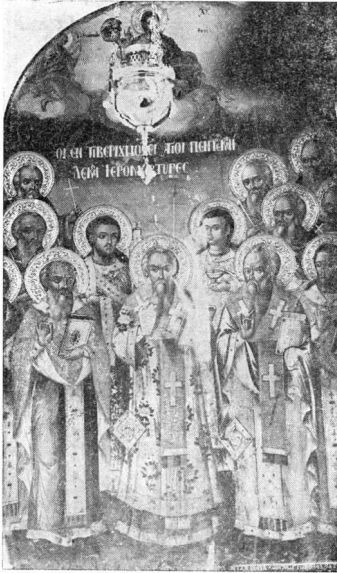
Εἰκ. 3. Οἱ Πεντεκαίδεκα Ἱερομάρτυρες. Εἰκὼν μεταφρεθεῖσα τὸ 1913 ἀπὸ τὴν Στρώμνιτσαν εἰς τὴν Κιλκίς (Αὐτόθι, σ. 60)

καὶ αὐτὸν θάνατον. Ἐπει δὲ ταῦτα τέλος εἶχον, χεῖρες μὲν ἐκείναι κυσὶν εἰς βρῶσιν ἐρρίφθησαν. Γυνὴ δὲ τις ἐκ γενετῆς τυφλή, οὕτω παρὰ τυχόν τῆς δεξιᾶς τοῦ ὁσίου Πέτρου χειρὸς εἰς τοὺς πόδας αὐτῆς πεσοῦσης αισθηομένη λαβοῦσα ταύτην ἀνείλατο· καὶ τῇ τῆς κεφαλῆς αὐτῆς καλύπτρα ταύτην ἐνει-