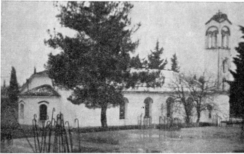
Εἰκ. 4. Ὁναὸς τῶν Πεντεκαίδεκα Ἱερομαρτύρων εἰς τὸ Κιλκίς

τῶν 15 Ἱερομαρτύρων, τὴν δὲ ἐπομένην Κυριακὴν τῆς 28ης Νοεμβρίου ταῦτα μεταφέρονται εἰς Θεσσαλονίκην πρὸς προσκύνησίν των καὶ ὑπὸ τῶν Στρωμνιτωτῶν Θεσσαλονίκης, οἱ ὅποιοι ὀργανώνουν εἰδικὸν φιλολογικὸν καὶ θρησκευτικὸν μνημόσυνον. Φωτογραφίαι τοῦ ἱεροῦ λειψάνου τῆς δεξιᾶς χειρὸς τοῦ ἁγίου Πέτρου καὶ τῆς εἰκόνας τῶν 15 Ἱερομαρτύρων ἐδημοσιεύθησαν νῦν τὸ πρῶτον εἰς πρόσφατον περὶ Στρωμνίτσης μονογραφίαν μου 1 . Εἰς ἄλλα διαμερίσματα τῆς Ἑλλάδος δὲν διεπιστάθη ἐκδήλωσις τιμητικῆς λατρείας τῶν 15 Ἱερομαρτύρων, πλὴν τῆς Θεσσαλονίκης καὶ κυρίως τοῦ Κιλκίς, κατὰ παράδοσιν παλαιᾶν τῶν Στρωμνιτωτῶν.