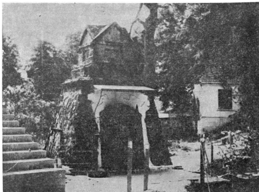
Εἰκ. 1. Σημερινὸν ἐξωκκλήσιον τῶν Πεντεκαίδεκα Ἱερομαρτύρων εἰς τὸν τόπον τοῦ μαρτυρίου

πον διυπατάμενης ὀξεῖ τῷ πετρῷ» 1 . Διὰ τοῦ μαρτυρικοῦ δὲ θανάτου αὐτῶν καὶ τῆς θαυματουργικῆς φήμης των ἐσφράγισαν οὗτοι τὸν πνευματικὸν βίον τῆς Στρωμνίτισης (εἰκ. 1) καὶ τῶν περιχώρων ἀλλὰ καὶ ὀλοκλήρου τῆς Μακεδονίας. «Τὰ μέντοι θαύματα οὐ μόνους τῆς ἐγχωρίου ἐχορήγουν ἀφθόνως, ἀλλ' ἤδη καὶ ἄχρι τῆς ὑπερορίας φθάνοντα, τῇ τοῦ Χριστοῦ δυνάμει ἀπερίγρα-