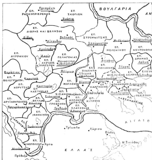
Χάρτης 2. Ἐκκλησιαστικὴ διαίρεσις τῶν βιλαετιῶν Θεσσαλονίκης-Μοναστηρίου-Κοσσυφοπεδίου, τῶν ἀρχῶν τοῦ 20οῦ αἰῶνος (Ἀρχεῖον χειρῶν ΙΜΧΑ)

δρφ. Ὑπεβλήθησαν τῇ Ἐκκλησίᾳ παράπονα ἐπὶ τῷ ὅτι τινὲς τῶν ἁγίων ἀρχιερέων, ὧν ἐν ταῖς ἐπαρχίαις ὑπάρχουσι καὶ Χριστιανοὶ Ὀρθόδοξοι Σερβικῆς καταγωγῆς, οὐ μετὰ τῆς προσηκούσης προθυμίας προνοοῦσι περὶ τῆς προστασίας τῶν πνευματικῶν αὐτῶν συμφερόντων, παρέχοντες ἀφορμὰς ὑπονοίας περὶ τοῦ ὅτι ποιοῦνται διάκρισιν μεταξὺ τῶν διαφόρου φυλῆς ὀρθό-