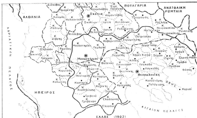
Χάρτης 1. Πολιτικὴ διαίρεσις τῶν βιλαετιῶν Θεσσαλονίκης-Μοναστηρίου-Κοσσυφοπέδιου, τῶν ἀρχῶν τοῦ 20οῦ αἰῶνος (Ἄρχειον χαρτῶν IMXA)

α. Ἡ ἀρχὴ τῆς ἰσοπολιτείας καὶ ἰσονομίας μεταξὺ Ἑλλήνων καὶ Σέρβων ὡς ὁμόδοξων. Τὸ Οἰκουμενικὸν Πατριαρχεῖον ὡς Μητὴρ Ἐκκλησία πάντοτε ἀλλ' ἰδιαίτερος τὰς δύο τελευταίας δεκαετίας πρὸ τῶν βουλκανικῶν πολέμων, κατέβαλλεν ἰδιαίτερας προσπάθειάς ὥστε ὅλοι οἱ ὁμόδοξοι λαοὶ τοῦ νὰ τυγχάνουν τῆς αὐτῆς μεταχειρίσεως ὡς πρὸς τὴν ἐξυπηρέτησιν τῶν πνευματικῶν ἀναγκῶν τῶν.