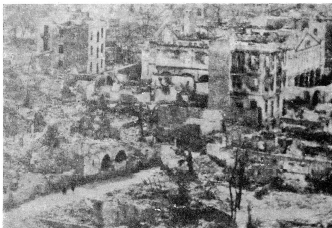
Εικ. 3. Τὸ κτίσμα καὶ ὁ ναὸς τοῦ ἁγίου Νικολάου Τραπεζοῦ