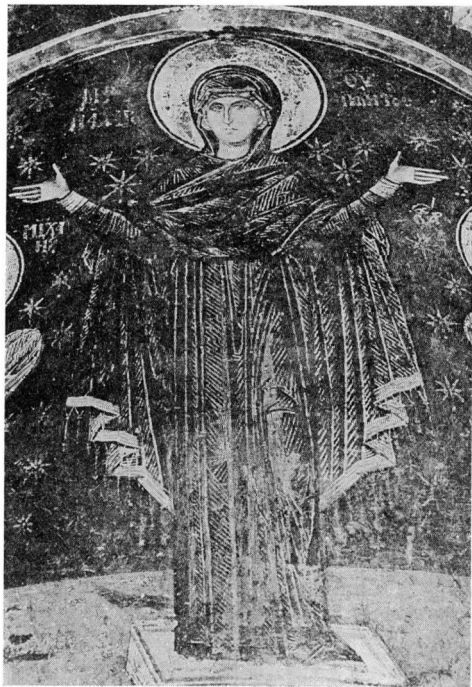
Εικ. 5. Ἡ Ἀχειροποίητος τῆς κόγχης τοῦ ἱεροῦ τοῦ ἀγίου Νικολάου Ὁρφανοῦ Θεσσαλονίκης

κιβώριο του αγίου, όπου υπήρχε και εικόνα της Θεοτόκου Ευταξίας. Ο ίδιος υποθέτει ότι μετά την ανάπτυξη της λατρείας του ντόπιου μάρτυρα ή Θεοτόκος δέν είχε πλέον θέση μέσα στο ναό του, γι' αυτό και αναζητήθηκε άλλος χώρος, όπου μεταφέρθηκε ή λατρεία της. Ο νέος χώρος ήταν