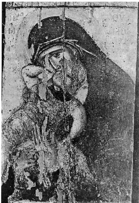
Εἰκ. 4. Ἡ Παναγία Ἀβραμιώτισσα τῆς μονῆς Χελανδαρίου

Ὁ Δ. Πάλλας σὲ πρόσφατο δημοσίευσμά του γιὰ τὸ κιβώριο τοῦ ἁγίου Δημητρίου ἐρμηνεύει μὲ διαφορετικὸ τρόπο τὸ πρόβλημα τῆς μεταλλαγῆς τῆς εἰκόνας καὶ τῆς μετονομασίας τοῦ ναοῦ 1 . Ἐπανερχεται στὴν παλιὰ ἄποψη τοῦ Th. Usrenkij, ὅτι ἡ «κυρία Εὐταξία» τοῦ πρώτου βιβλίου τῶν