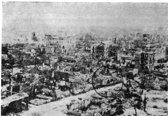
Εικ. 2. Ἡ καμένη περιοχή βόρεια ἀπὸ τὸ ναὸ τοῦ ἁγίου Νικολάου Τραπεζοῦ. Ἀριστερὰ φαίνεται μέρος τῆς Ἀχειροποιήτου καὶ ὁ μυναρὲς τῆς. Διακρίνεται τὸ κτίσμα μὲ τις δύο καμάρες στὴν πρόσοψη