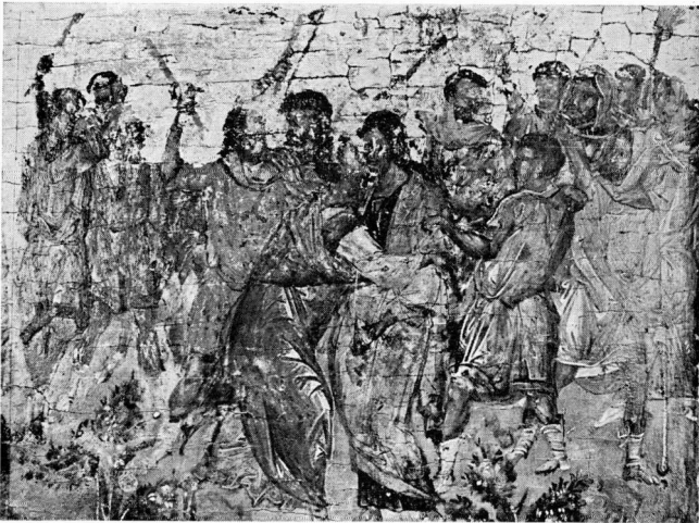
β. Ἡ Προδοσία