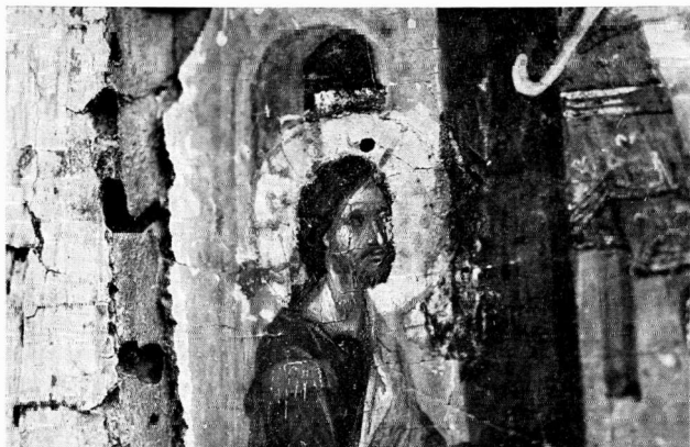
α. Ὁ Χριστός στο Μυστικὸ Δεῖπνο