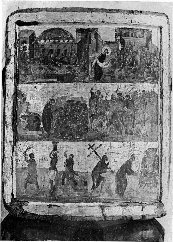
Εικόνα με σκηνές από τὰ πάθη Μ. Βλατάδων