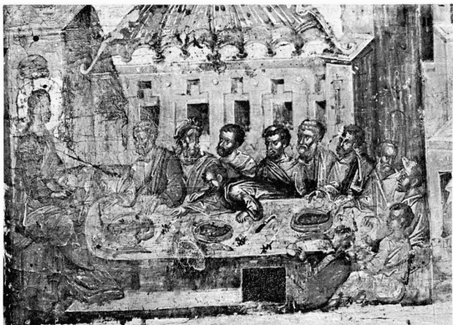
α. Ὁ Μυστικός Δείπνος