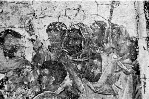
β. Δεξιὸς ὄμιλος Πρωδοσίας