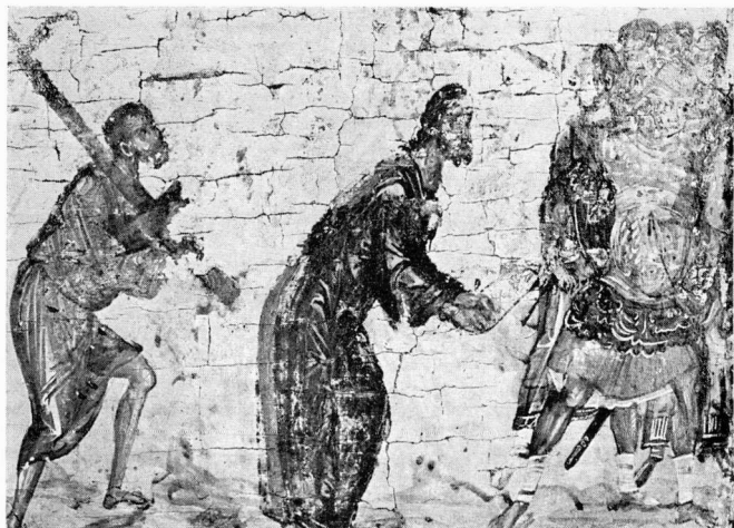
β. Ὁ Ἐλκόμενος