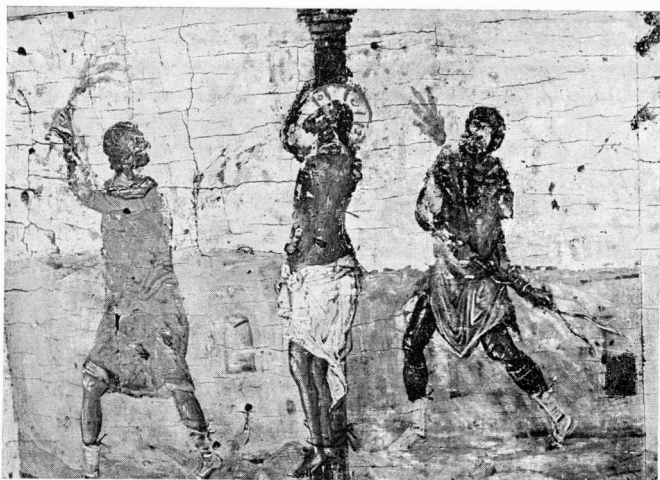
α. Ἡ Μαστίγωση