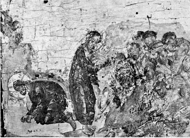
α. Ἡ Προσευχή