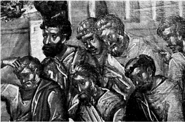
α. Οι Ἀπόστολοι στὸ Νιπήρα