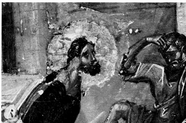
β. Ὁ Χριστός στο Νativίτηρα