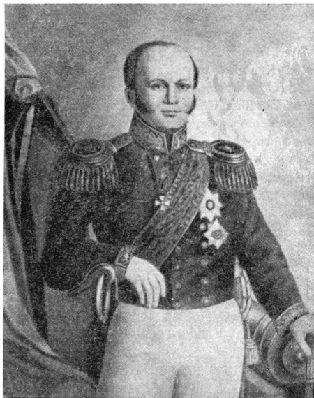
Εικ. 1. Ο Ρώσος ναύαρχος Σενιάβιν

Και αυτά γίνονται την άνοιξη του 1808, χωρίς τη συνδρομή πιά των Ρώσων, εφόσον ο ναύαρχος τους στο Αίγαίο Σενιάβιν (βλ. εικ. 1) είχε πάρει διαταγή του τσάρου από τις 12 Αυγούστου 1807 να σταματήσει τις επιχειρήσεις έναντι των Τούρκων 1 , αλλά ο ίδιος φαίνεται δέν έπαψε να έχει