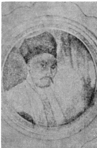
Εἰκ. 1. Ὁ Barthelemy Edward Ἀββοτ

νε μιὰ μικρὴ περιουσία καὶ πήρε γυναίκα μιὰ Ναουσαία, μετὴν ὁποία ἀπέκτησε δύο ἀγόρια, τὸν Τζάρλ καὶ τὸν Τζάκ. Καὶ ὅταν ὁ πατέρας του πέθανε, τοὺς ἄφησε τῇ φιλίᾳ τῶν Ἑβραίων, 6 ἀσημένια κουτάλια καὶ μιὰ σκλάβο Μεσολογγίτισσα, ποὺ τὴν εἶχε ἀγοράσει στὸ παζάρι τῆς Θεσσαλονίκης τὸν καιρὸ τῆς Ἑλληνικῆς Ἐπαναστάσεως. Μέσα ἀπὸ τὶς πληροφορίες αὐτὲς τὶς τρομερὰ ἀλλοιωμένες, δὲν δυσκολεύεται ὁ ἱστορικὸς τῆς Μακε-