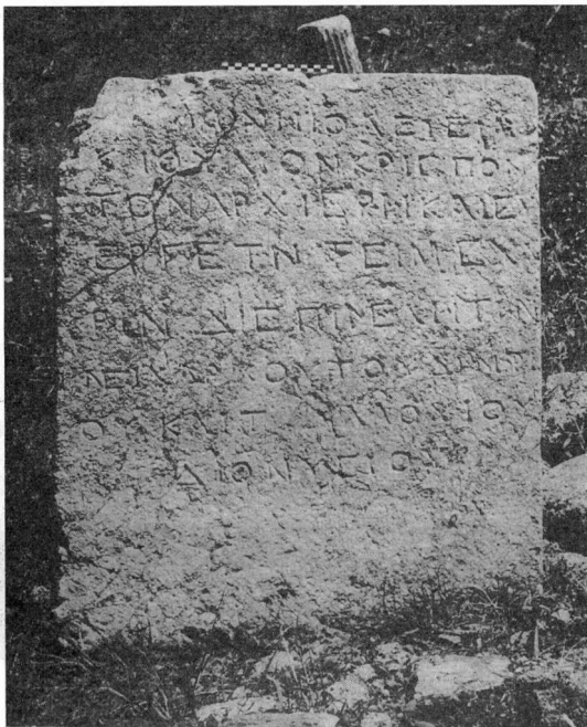
Εἰκ. 2. Ἑλληνικὴ ἐπιγραφή ρωμαϊκῶν χρόνων στὴν ἐκκλησία τῶν Ἁγίων Ἀποστόλων.

Καὶ πρῶτα ἀπ' ὅλα ἡ ἐπιγραφή δὲν εἶναι πιά «ἐντοιχισμένη στό ναό». Εἶναι στημένη στὰ ἐρείπια γιὰ φωτογραφία, ποῦ πῆρα τὸ 1961 καὶ δημοσιεύεται ἐδῶ (εἰκ. 2), ὅπως φαί-