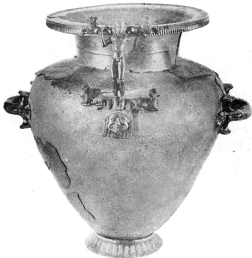
Εικ. 1. Χάλκινη ύδρία (συμπληρωμένη)

62-63. Άσημένα περιδέραια (τό ένα πίν. XV, 2), με απολήξεις σε κεφάλι φιδιού.