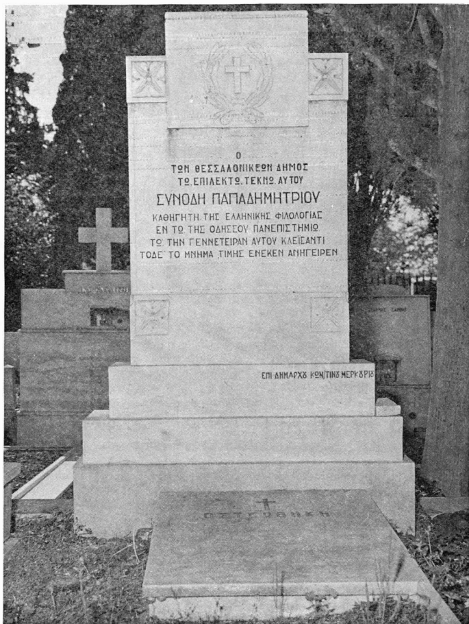
Εικ. 5. Ὁ τάφος τοῦ Συνόδη Παπαδημητρίου στὸ νεκροταφεῖο τῆς Παναγίας τῆς Ἐδαγγελιστρίας στὴ Θεσσαλονίκη