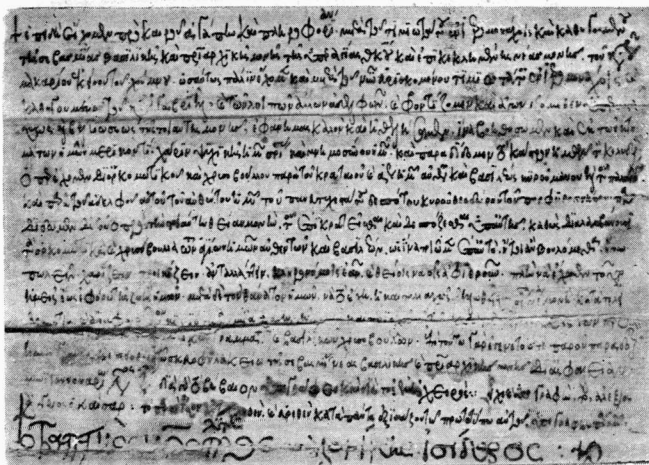
Τὸ ἀντίγραφον τοῦ δωρητηρίου ἐγγράφου τοῦ καίσαρος Ἀλεξίου Ἀγγέλου διὰ τὴν Νέαν Μοῆν με ὑπογραφὴν τοῦ μητροπολίτου Θεσσαλονίκης Ἰσιδώρου (τοῦ Γλαβά).