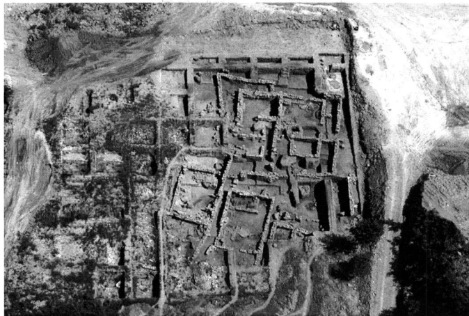
Εικ. 4. Αεροφωτογραφία του οικοδομικού συγκροτήματος στη θέση Καλλίπετρα.