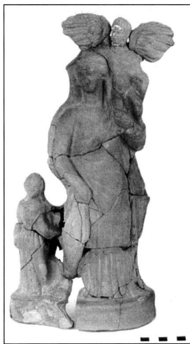
Εικ. 8. Ειδώλιο Αφροδίτης με συνοδεία Έρωτα και μικρού κοριτσιού/λάτρισσας.