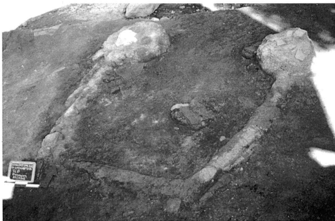
Εικ. 5. Η τραπεζιόσχημη κατασκευή - βωμός στον χώρο 19.