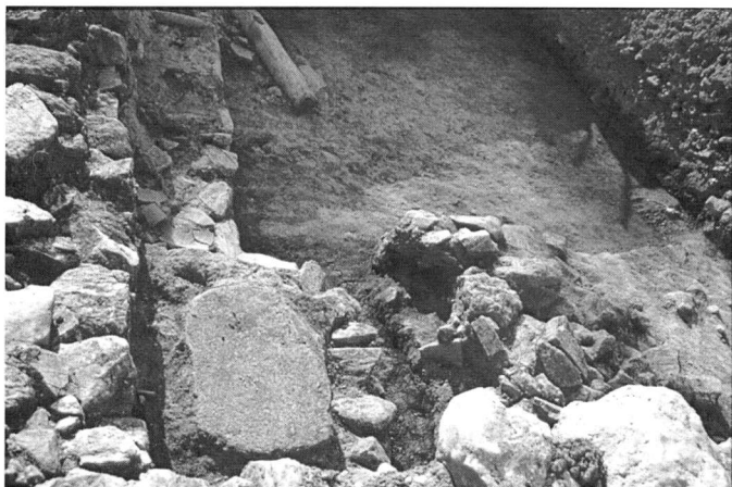
Εικ. 12. Αποψη των κατασκευών του βορειοδυτικού τομέα του χώρου 12.