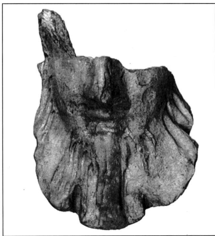
Εικ. 9. Τμήμα γενειοφόρας κεφαλής από τον χώρο 2.