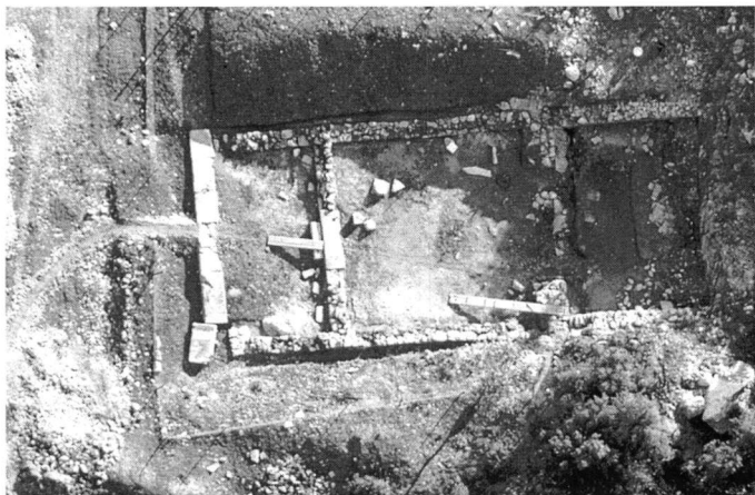
Εικ. 2. Αεροφωτογραφία του ρωμαϊκού ναού της Μητέρας των Θεών.