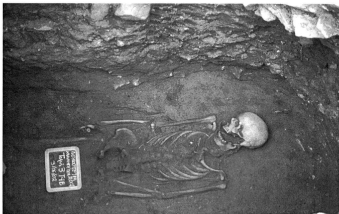
Εικ. 13. Ο νεκρός του χώρου 12.