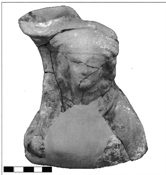
Εικ. 11. Πήλινη προτομή γυναικείας μορφής με κέρατα από τον χώρο 13.