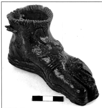
Εικ. 7. Πλαστικός ηθμός με τη μορφή ποδιού από τον χώρο 18.