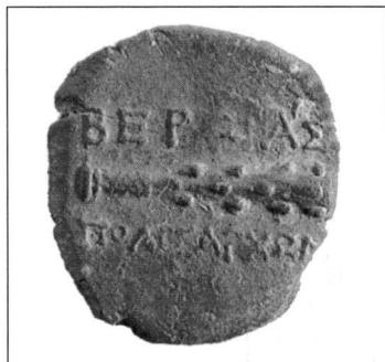
Εικ. 10. Πήλινο σφράγισμα από τον χώρο 3.