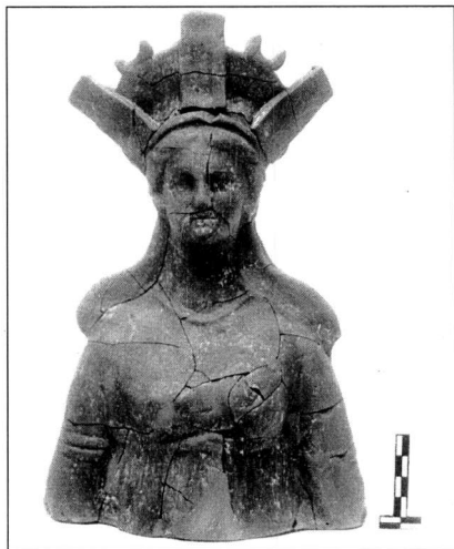
Εικ. 6. Πήλινο ειδώλιο της Μητέρας των Θεών από τον χώρο 19.