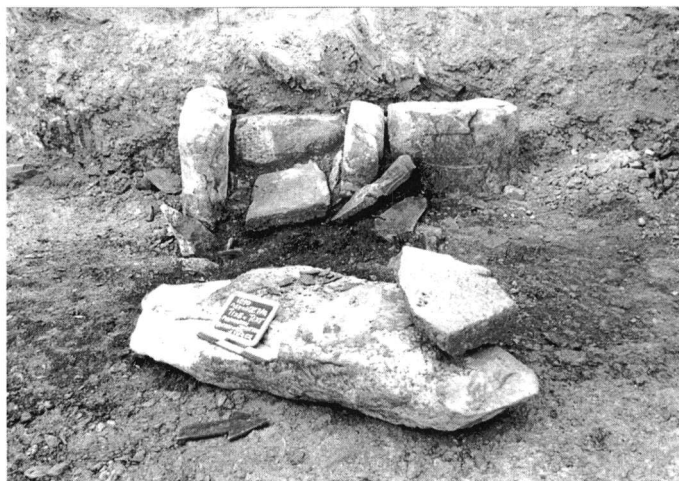
Εικ. 3. Αποψη του δυτικού χώρου του ναού.