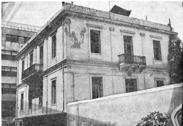
Τὸ ἑλληνικὸ Προξενεῖο τῆς Θεσσαλονίκης