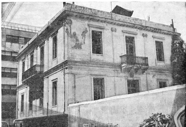
Τὸ ἑλληνικὸ Προξενεῖο τῆς Θεσσαλονίκης