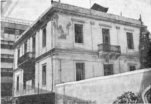
Τὸ ἑλληνικὸ Προξενεῖο τῆς Θεσσαλονίκης

ὁ ὄρισμός τοῦ Μακεδονικοῦ Ζητήματος, ποῦ διατυπώθηκε ἀπὸ τὸν ἀείμνηστο Καθηγητὴ Νικόλ. Βλάχο, πὼς «ὑπὸ τοῦτο νοοῦμεν τὴν τάσιν τῶν χριστιανικῶν κρατῶν τῆς χερσονήσου τοῦ Αἴμου πρὸς ἀποκατάστασιν Ἐθνικὴν ἀναλώμασιν ἐδάφους, ἀνήκοντος δικαίωματι κατακτητικῶ εἰς τὸν Ὀθωμανὸν Σουλτᾶνον» 1 , δὲν θὰ μπορούσε νὰ σταθῆ, γιατί, ἀσφαλῶς, δὲν θὰ ἦταν δυνατὸν νὰ δοθῆ σ' αὐτὸ ἡ λύσι, ποῦ δόθηκε μὲ τοὺς πολέμους τοῦ 1912-13. Ἀπλούστατα τὸν Τοῦρκο κατακτητὴ θὰ εἶχε διαδεχτῆ, πολὺ πρὶν ἀπὸ τοὺς βαλκανικοὺς πολέμους, ἓνας κατακτητὴς καινούριος, ὁ Βούλγαρος. Κι αὐτὸ θὰ ἦταν κακὴ λύσι, γιατί θὰ ἦταν πέρα ὡς πέρα λύσι ἄδικη.