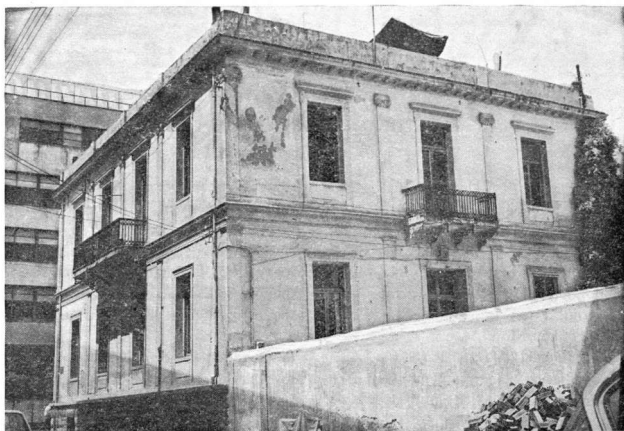
Τὸ ἑλληνικὸ Προξενεῖο τῆς Θεσσαλονίκης

ὁ ὄρισμός τοῦ Μακεδονικοῦ Ζητήματος, ποῦ διατυπώθηκε ἀπὸ τὸν ἀείμνηστο Καθηγητὴ Νικόλ. Βλάχο, πὼς «ὑπὸ τοῦτο νοοῦμεν τὴν τάσιν τῶν χριστιανικῶν κρατῶν τῆς χερσονήσου τοῦ Αἴμου πρὸς ἀποκατάστασιν Ἐθνικὴν ἀναλώμασιν ἐδάφους, ἀνήκοντος δικαίωματι κατακτητικῶ εἰς τὸν Ὀθωμανὸν Σουλτᾶνον» 1 , δὲν θὰ μπορούσε νὰ σταθῆ, γιατί, ἀσφαλῶς, δὲν θὰ ἦταν δυνατὸν νὰ δοθῆ σ' αὐτὸ ἡ λύσι, ποῦ δόθηκε μὲ τοὺς πολέμους τοῦ 1912-13. Ἀπλούστατα τὸν Τοῦρκο κατακτητὴ θὰ εἶχε διαδεχτῆ, πολὺ πρὶν ἀπὸ τοὺς βαλκανικοὺς πολέμους, ἓνας κατακτητὴς καινούριος, ὁ Βούλγαρος. Κι αὐτὸ θὰ ἦταν κακὴ λύσι, γιατί θὰ ἦταν πέρα ὡς πέρα λύσι ἄδικη.