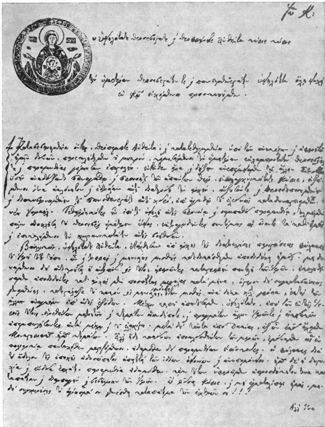
Εικ. 1. Πανομοίωτο της πρώτης σελίδας του υπ' αριθμ. 3 εγγράφου