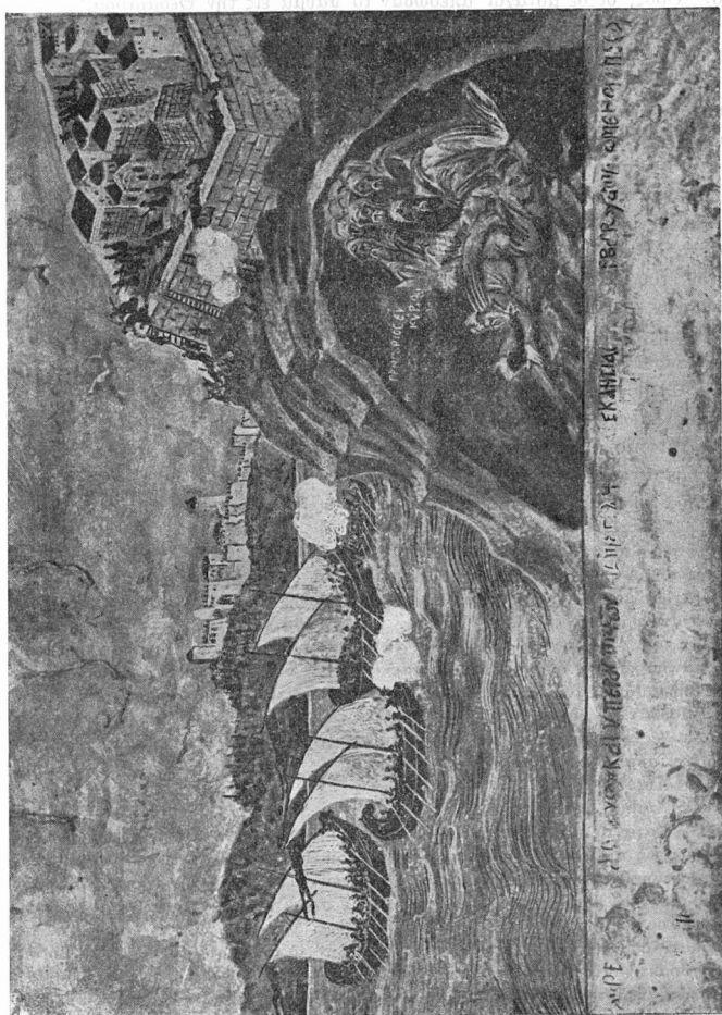
Εἰκὼν ἐπὶ περὶ περὶ πειρατείας ἐπιβίβασιν πειρατῶν κατὰ τοῦ Ἁγίου Ὄρους.