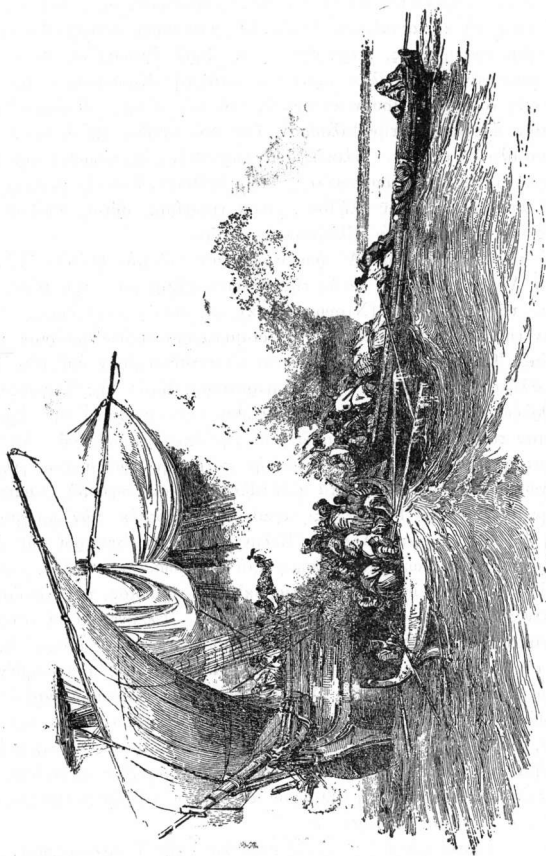
Ἐπίθεσις ἑλληνικῶν πειρατικῶν κατὰ ἑμπορικῶν σκάφους.