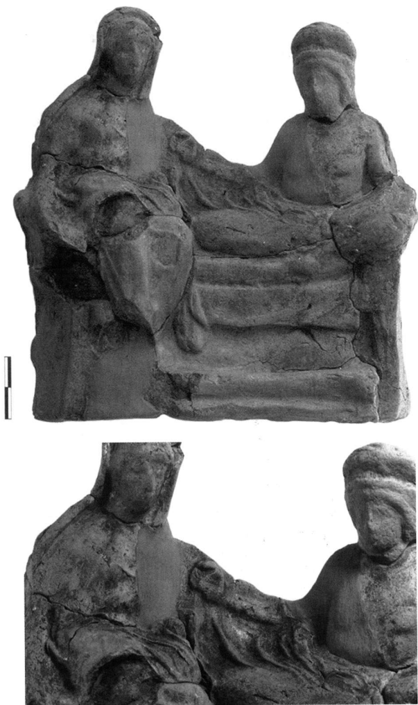
Πίν. 1. Πήλινο σύμπλεγμα σε κλίνη.