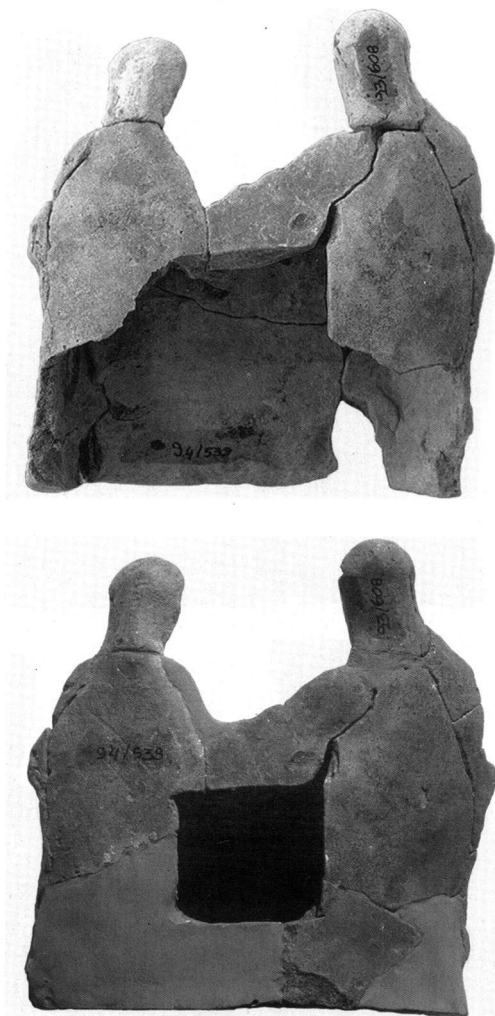
Πίν. 2. Η πίσω πλευρά του συμπλέγματος πριν και μετά τη συμπλήρωση.