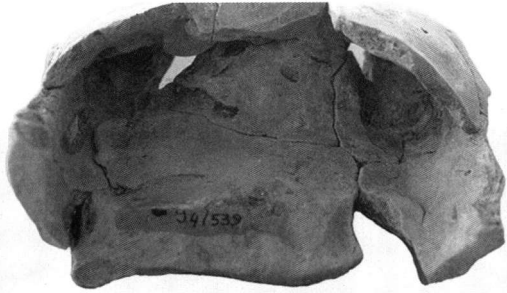
Πίν. 3. 1. Η εσωτερική πλευρά του συμπλέγματος.