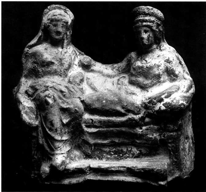
Πίν. 4. Πήλινο σύμπλεγμα από τη Βεργίνα.