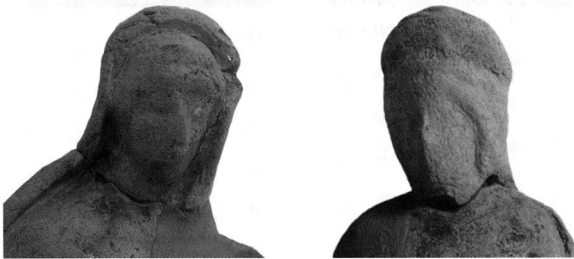
Πίν. 3. 2. Λεπτομέρειες του συμπλέγματος.