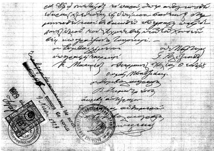
Εικ. 2. Τέλος της δεύτερης σελίδας του πρώτου εγγράφου.