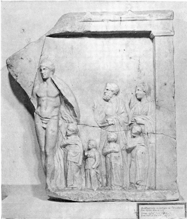
Ἐναθηματικὸ ἀνάγλυφο ἀπὸ τὴν Ποτειδαία. Μουσεῖο Πολυγύρου