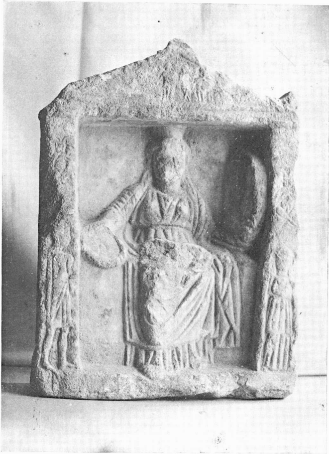
Ναΐσκος Κυβέλης από τὴν Ἀμφίπολη. Μουσείο Θεσσαλονίκης