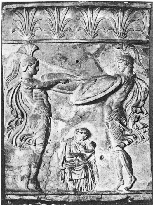
Ἀνάγλυφο Campana . Γλυπτοθήκη Ny Carlsberg