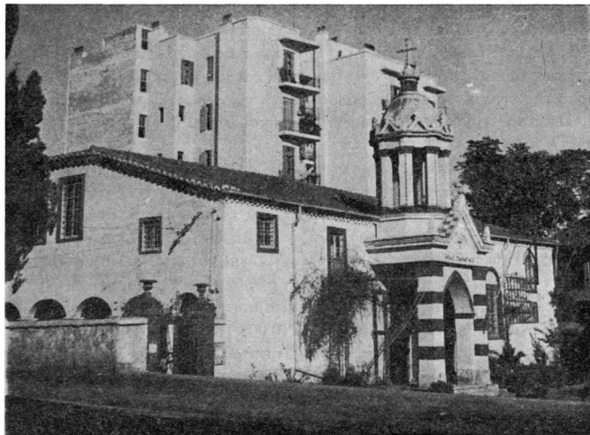
Εἰκ. 2. Ἡ ἐκκλησία τῆς Μεγάλης Παναγίας

δύο γυναικεῖες μονές 1 , τῆς Ἁγίας Θεοδώρας καὶ τῆς Θεοτόκου, μὲ τὴν διαφορά ὅτι μᾶς δίνει περισσότερες πληροφορίες. Ἡ μονὴ τῆς Ἁγίας Θεοδώρας ταυτίζεται βέβαια μὲ τὴν γνωστὴ ὁμώνυμη σημερινὴ ἐκκλησία 2 . Ἡ τρίτη μονὴ τῆς Θεοτόκου φαίνεται ὅτι βρισκόταν στὴν θέση τῆς σημερινῆς Μεγάλης Παναγίας ἀπέναντι ἀπὸ τὸν κινηματογράφο «Ἡλύσια» 3 (βλ. εἰκ. 2) καὶ