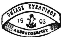
Εικ. 2. Σφραγιδες συλλόγων Θεσσαλονίκης, Σερρών, Γευγελής, Μπερόβης, 'Ασβεστοχωρίου