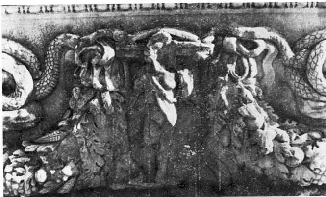
β. Μουσείον Βερούας, ᾠ. Αριθ. κατ. 483 (λεπτομέρεια)