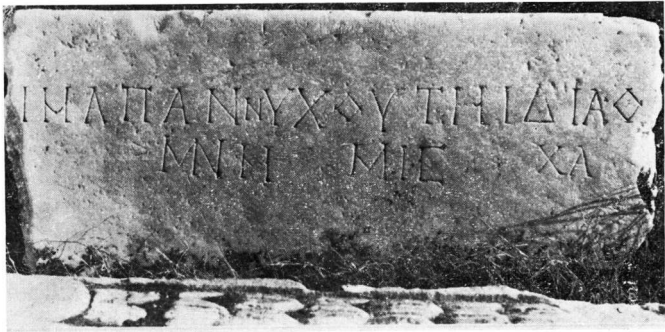
α. Μουσείον Βερούας, ᾠ. Αριθ. κατ. 312