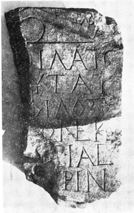
β. Μουσείον Βερούας. Ἀριθ. κατ. 308