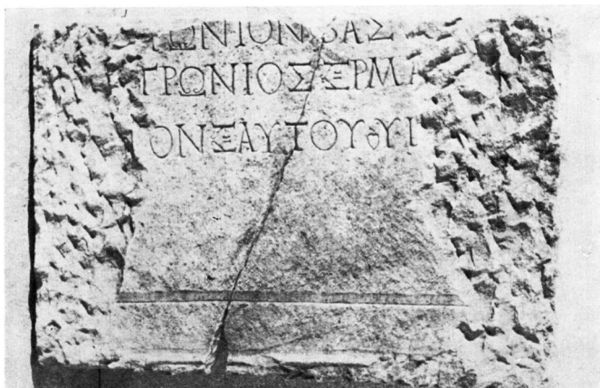
α. Μουσείον Βερούας. Ἀριθ. κατ. 149 (β' ὄψις)