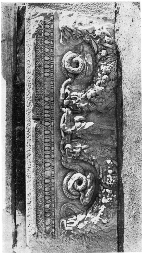
Μοναστήριον Βερούσιας. Ἐπιθ. κατ. 483