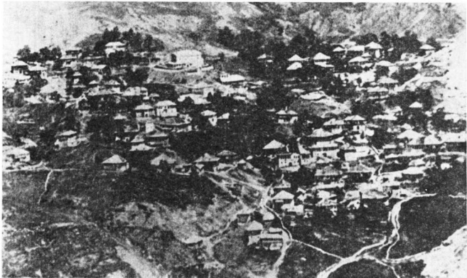
Εἰκ. 1. Ἐξ ἀποψὸς τοῦ χωριοῦ Ἄνω Μπεάλα

γυμνὸ «Κουρία», ἄλλο τὸ «Κατούνι» κι ὁ βράχος «Μπαρτσιρέ». Δυτικὰ λειβάδια μὲ ὀνομασίες «Παδδίτσια» καὶ «Ντομνιάσκα». Στὰ νοτιοανατολικά μικρὸ ὕψωμα τραπεζοειδὲς κατὰφυτο, «Εἰκόνα» τὸ ἔλεγαν. Ἐπὶ τὴν «Εἰκόνα» ἀγνάντευε κανεῖς, μέσα ἀπὸ τὸ ἄνοιγμα τῶν ἀνατολικῶν ὑψωμάτων πρὸς τὸν κάμπο κι τῶν ἀντερείσμάτων τοῦ ὁμώνυμου τοῦ χωριοῦ βου-