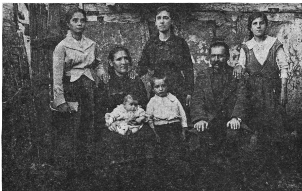
Εἰκ. 3. Οἰκογένεια ἐμπόρου ἀπὸ τὴ Μπεάλα, ἐγκατεστημένη στὴ Στρούγα

Οἱ γυναῖκες καὶ τὰ κορίτσια ἦταν νοικοκυρές. Ἀσχολίες, ἐκτὸς τῶν οἰκιακῶν, εἶχαν τὴ βιοτεχνία χαλιῶν, βελέντζας, φλοκάτης, ὕφανση μάλ- λινων καὶ βαμβακερῶν ὕφασμάτων, πλέξιμο καλτσῶν κ.ἄ. Τὸ ὕφαντήριο σὲ κάθε σπίτι ἔπιανε ἰδιαίτερο μέρος κι ἦταν ἀπαραίτητο. Ἡ ρόκα κι ἡ ροδάνη μὲ τὸ κάτωσπρο μαλλί γιὰ τὸ γνέσιμο ἀποτελοῦσαν τὰ ἀπαραίτητα