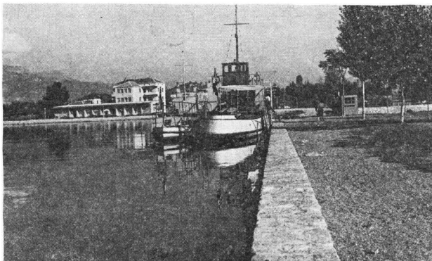
Εἰκ. 7. Οἱ ἐκβολὲς τοῦ ποταμοῦ Λοίνου στὴν πόλη Στρούγα

Μέχρι τοῦ 1876 στὴ Στρούγα καὶ σ' ὅλη τὴν περιοχὴ τῆς Ἀχρίδος εἶχαν ἑλληνικὰ σχολεῖα καὶ ἑλληνικὲς ἐκκλησίες. Ὅλοι οἱ κάτοικοι ἦσαν συνδεδεμένοι μὲ τὴν ὀρθόδοξη χριστιανικὴ θρησκεία καὶ ἐλάμβαναν ἑλληνικὴ μόρφωση στὰ σχολεῖα, ἀνεξάρτητα ἂν καὶ πολλοὶ ὀμιλοῦσαν τὸ λεγόμενον σλαβικὸ ἰδίωμα. Τὸ σλαβικὸ αὐτὸ ἰδίωμα σήμερα ἔχει ἀλλάξει σὲ πολλὰ, δὲν