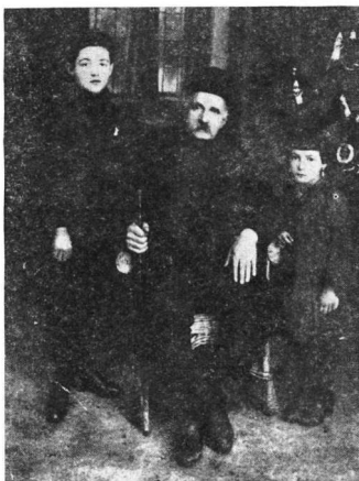
Εικ. 2. Έμπορος τής Μπεάλας τó έτος 1912

Οί άνδρες, όλοι σχεδόν, από τά πρώτα χρόνια τής τουρκοκρατίας, άσχο- λοϋνταν με τó εμπόριο, περισσότερο μανιφατούρας και ειδών παντοπω- λείου. Στίς πόλεις Στρούγα, Άχρίδα, Τίρανα και Δυρράχιο οί μεγαλύτε- ροι έμποροι ήσαν από τήν Μπεάλα (εικ. 2,3). Οί περισσότεροι όμως ήσαν σκορπισμένοι στα χωριά τής Δίβρας και Μάτι (Άλβανίας) (εικ. 4). Λίγοι