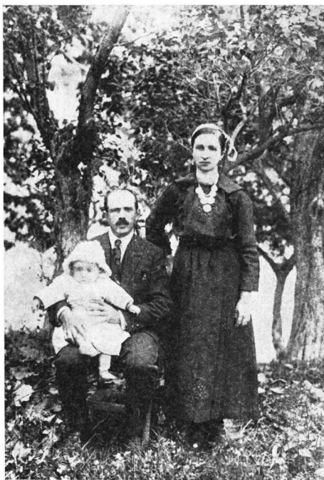
Εἰκ. 5. Νεαρὸ ζευγάρι τῆς Μπεάλας

Οἱ ἄνδρες παλαιότερα φοροῦσαν φουστανέλλες ἄσπρες, φέρμελες, τουζλούκια καὶ ντουλαμᾶ, ὅπως διατηροῦνταν σὲ κάθε σπίτι σὺν κειμήλια,