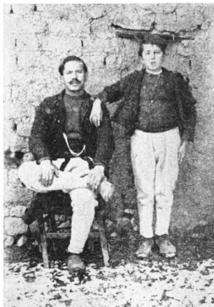
Εἰκ. 4. Ἐμπορὸς τῆς Μπεάλας σὲ ἀσβαντοζόου

αύλακι πού ἔβγαινε ἀπό τὸ μύλο τὸ νερὸ χυνόταν μέσα σὲ σωλήνα, ἀπαράλλακτο σὰν τοῦ μύλου (ἀπὸ ὕψους 3-4 μέτρων) μὲ ἀρκετὴ δύναμη σὲ παραχωμένο κάτω ξύλινο μεγάλο κάδο σχήματος κώνου, πού στὸ ἐπάνω μέρος εἶχε διάμετρο δύο μέτρων καὶ στὸ κάτω ἦταν πολὺ στενὸ. Ἡ περιδίνηση τοῦ ἄφθονου καθαροῦ νεροῦ, ὅταν ξαπολύοταν μέσα στὸν κάδο ἦταν μεγάλη.