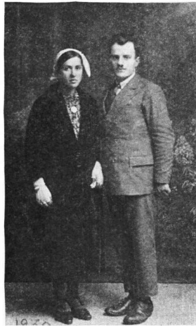
Εἰκ. 6. Νεόνυμφοι ἀπὸ τὴν Κάτω Μπεάλα

Οἱ νέοι καὶ τὰ παιδιὰ φοροῦσαν μάλλινα ρούχα (τζακέτες, πανταλόνια χονδρά ποὺ κουμπώνονταν στὶς κνήμες καὶ περιδέονταν μὲ περικνημίδες