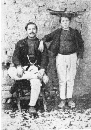
Εἰκ. 4. Ἐμπορὸς τῆς Μπεάλας σὲ ἀσβαντοχώρι

αύλακι πού ἔβγαине ἀπό τὸ μύλο τὸ νερὸ χυνόταν μέσα σὲ σωλήνα, ἀπαράλλακτο σὰν τοῦ μύλου (ἀπὸ ὕψους 3-4 μέτρων) μὲ ἀρκετὴ δύναμη σὲ παραχωμένο κάτω ξύλινο μεγάλο κάδο σχήματος κώνου, πού στὸ ἐπάνω μέρος εἶχε διάμετρο δύο μέτρων καὶ στὸ κάτω ἦταν πολὺ στενὸ. Ἡ περιδίνηση τοῦ ἄφθονου καθαροῦ νεροῦ, ὅταν ξαπολύοταν μέσα στὸν κάδο ἦταν μεγάλη.