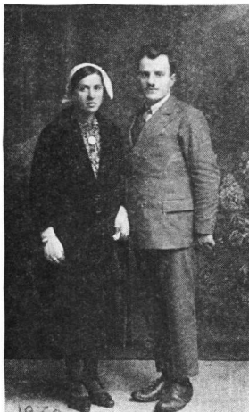
Εἰκ. 6. Νεόνυμφοι ἀπὸ τὴν Κάτω Μπεάλα

Οἱ νέοι καὶ τὰ παιδιὰ φοροῦσαν μάλλινα ρούχα (τζακέτες, πανταλόνια χονδρά ποὺ κουμπώνονταν στὶς κνήμες καὶ περιδέονταν μὲ περικνημίδες