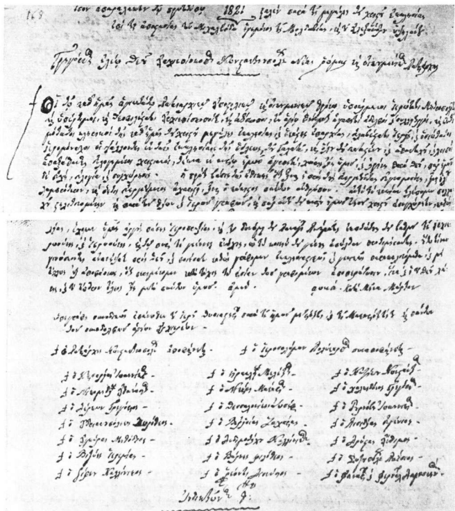
Εἰκ. 2. Ἡ ἀρχὴ καὶ τὸ τέλος τοῦ ἀφορισμοῦ τοῦ Ὑψηλάντου (Κώδιξ ἀπογράφων Ἐπισκοπῆς Σερβίῳ καὶ Κοζάνης, 1815-1831, σ. 168-170)

κείμενοι Ἱερώτατοι Μητροπολίται, καὶ ὑπέρτιμοι καὶ Θεοφιλέστατοι Ἀρχιεπίσκοποι τε καὶ Ἐπίσκοποι, ἐν Ἀγίῳ Πνεύματι ἀγαθητοὶ ἀδελφοί, καὶ συλλειτουργοί, καὶ εὐλαβέστατοι Ἱερεῖς, καὶ δσιώτατοι Ἱερομόναχοι, τιμώτατοι προεστώτες καὶ πρόκριτοι, καὶ λοιποὶ ἅπαξ ἄπαντες εὐλογημένοι χριστιανοί, χάρις εἰη ὑμῖν καὶ εἰρήνη παρὰ Θεοῦ ἡ ἐκκλησία