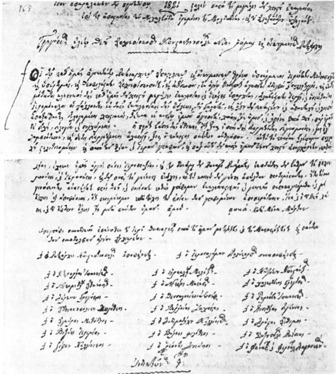
Εἰκ. 2. Ἡ ἀρχὴ καὶ τὸ τέλος τοῦ ἀφορισμοῦ τοῦ Ὑψηλάντου (Κώδιξ ἀπογράφων Ἐπισκοπῆς Σερβίῳ καὶ Κοζάνης, 1815-1831, σ. 168-170)

κείμενοι Ἱερώτατοι Μητροπολίται, καὶ ὑπέρτιμοι καὶ Θεοφιλέστατοι Ἀρχιεπίσκοποι τε καὶ Ἐπίσκοποι, ἐν Ἀγίῳ Πνεύματι ἀγαθητοὶ ἀδελφοί, καὶ συλλειτουργοί, καὶ εὐλαβέστατοι Ἱερεῖς, καὶ δσιώτατοι Ἱερομόναχοι, τιμιώτατοι προεστώτες καὶ πρόκριτοι, καὶ λοιποὶ ἀπαξ ἅπαντες εὐλογημένοι χριστιανοί, χάρις εἰη ὑμῖν καὶ εἰρήνη παρὰ Θεοῦ ἡ ἐκκλησία