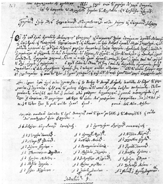
Εἰκ. 2. Ἡ ἀρχὴ καὶ τὸ τέλος τοῦ ἀφορισμοῦ τοῦ Ὑψηλάντου (Κώδιξ ἀπογράφων Ἐπισκοπῆς Σερβίῳ καὶ Κοζάνης, 1815-1831, σ. 168-170)

κείμενοι Ἱερώτατοι Μητροπολίται, καὶ ὑπέρτιμοι καὶ Θεοφιλέστατοι Ἀρχιεπίσκοποι τε καὶ Ἐπίσκοποι, ἐν Ἁγίῳ Πνεύματι ἀγαθητοὶ ἀδελφοί, καὶ συλλειτουργοί, καὶ εὐλαβέστατοι Ἱερεῖς, καὶ δσιώτατοι Ἱερομόναχοι, τιμώτατοι προεστώτες καὶ πρόκριτοι, καὶ λοιποὶ ἅπαξ ἄπαντες εὐλογημένοι χριστιανοί, χάρις εἰη ὑμῖν καὶ εἰρήνη παρὰ Θεοῦ ἡ ἐκκλησία