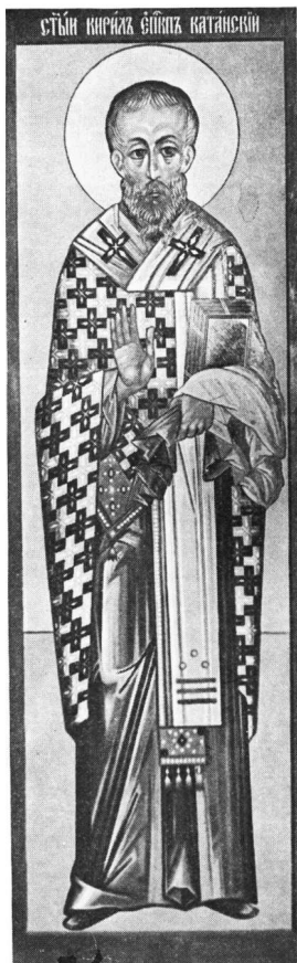
Εἰγ. 2. Ἡ εἰκὼν τοῦ ὁσίου Κυρίλλου

ἀμφίον καὶ Εὐαγγέλιον. Μὲ τὴν δεξιάν χεῖρα εὐλογεῖ μὲ ἀνοικτὴν τὴν παλάμην. Κατ' αὐτὸν τὸν τρόπον ἀναπαρίστανον συνήθως εἰς τὰς εἰκόνας τοὺς ἁγίους Πατέρας τῆς Ἐκκλησίας, ὡς τὸν Μέγαν Βασίλειον, Ἰωάννην τὸν Χρυσόστομον, Γρηγόριον τὸν Θεολόγον, Κύριλλον Ἀλεξανδρείας κ.ά. Ὡς ὁδηγὸς διὰ τὸν S. Bykadoγον ἐχρησίμευσε τὸ εἰκονογραφικὸν πρότυπον τοῦ Stroganov τοῦ τέλους τοῦ 16ου καὶ ἀρχῶν τοῦ 17ου αἰῶνος, ὅπου ὑπὸ ἡμερομηνίαν 14 Φεβρουαρίου ἀναγινώσκομεν: «τοῦ ἁγίου πατρὸς Κυρίλλου τοῦ Φιλοσό-