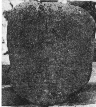
Εἰκ. 7. Μιλιάριον ὑπ' ἀριθ. 4.

Πα ρα τ η ρ ῆ σ ε ι ς: Ἡ A' ἐπιγραφή τῆς πρώτης ὄψεως, ἡ ἐλληνική, χρονολογεῖται εἰς τοὺς χρόνους τοῦ Γαλ. Βαλ. Μαξιμιανοῦ (293-311), συγκεκριμένως δὲ μετὰ τὸ ἔτος 305 (πβλ. C a g n a t, ἔ.ἀ., σ. 236). Ὁ τύπος παρὰ C a g n a t, ἔ.ἀ., σ. 278 (8η ὁμάς). Ἡ ἐπιγραφή τῆς B' ὄψεως, εἰς τοὺς χρόνους τοῦ Φλ. Ἰοβιανοῦ (27 Ἰουνίου 363-16 Φεβρουαρίου 364).