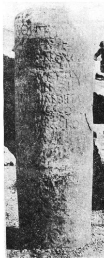
Εἰκ. 3-4. Μιλίριον ἐπ' ἀριθ. 2.