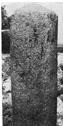
Εἰκ. 1-2. Μιλιάριον ὑπ' ἀριθ. 2.

τῆς ρωμαιοκρατίας. Ἴς ἐλπίσωμεν ὅτι εἰς τὸ μέλλον «ἀγαθῇ τύχῃ» θὰ ἀποκαλυφθοῦν καὶ αἱ ὁδοὶ τὰς ὁποίας ταῦτα «κατεστήλουν» 2 .