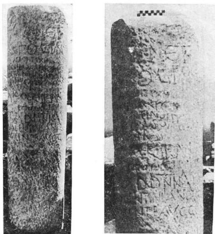
Εἰκ. 5 - 6. Μιλιάριον ὑπ' ἀριθ. 3.

Παρατηρήσεις: Ἡ Α' ἐπιγραφή (1,2,3,4,5,6,7,8,9,10,11) — διάστιχον 0,015μ - 0,02μ — χρονολογείται πιθανὸν εἰς τοὺς χρόνους τοῦ Γορδιανοῦ Γ' (238-244). Ὁ τύπος παρὰ C a g n a t, ἔ.ἀ., σ. 278 (8η ὀμάς). Ἡ Β' ἐπιγραφή (ἀριθμοὶ ἐντὸς παρενθέσεων) ἐπὶ αὐτοκράτορος Φλ. Κλ. Ἰουλιανοῦ (355-363) καὶ συγκεκριμένως μετὰ τὸ 360, χρονολογίαν ἀναγορεύσεώς του εἰς Αὐγούστον (πβλ. C a g n a t, ἔ.ἀ.,σ.245). Ἡ Γ' τέλος, ἡ λατι-