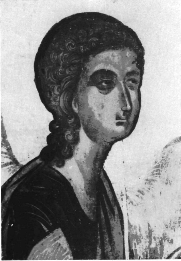
Ὁ Γαβριὴλ εἰς τὸ βημόθυρον τοῦ ναοῦ τῆς Ἑπαπαντῆς.