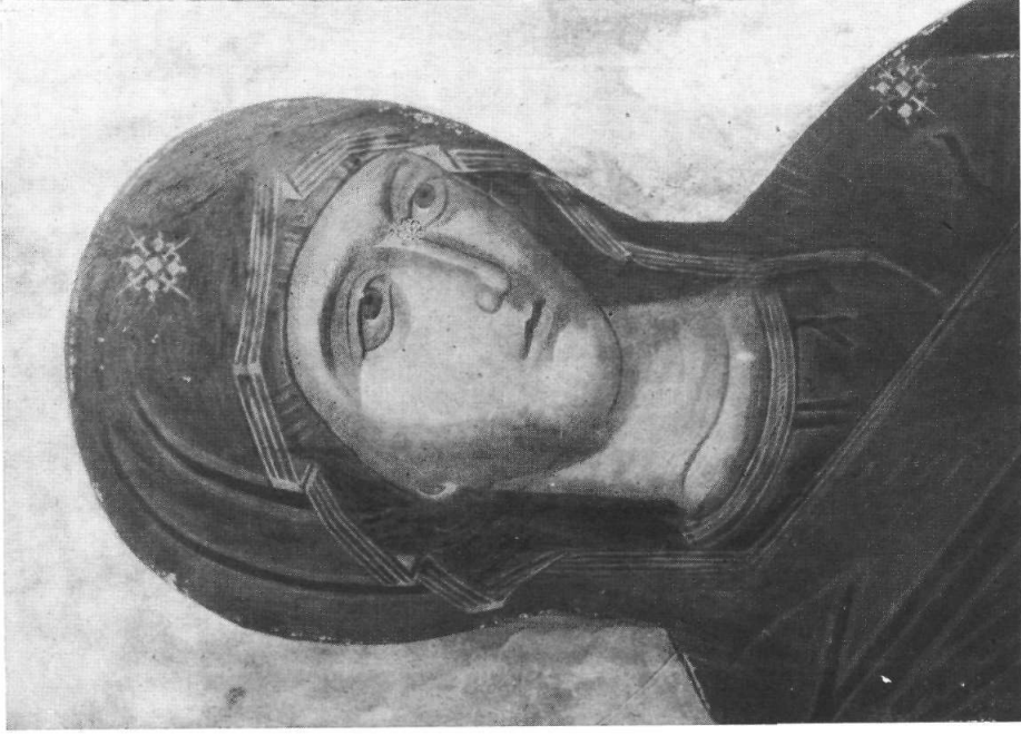
Ὁ Προπάτου τῶν Καρυῶν Ἁγίου Ὁρους.