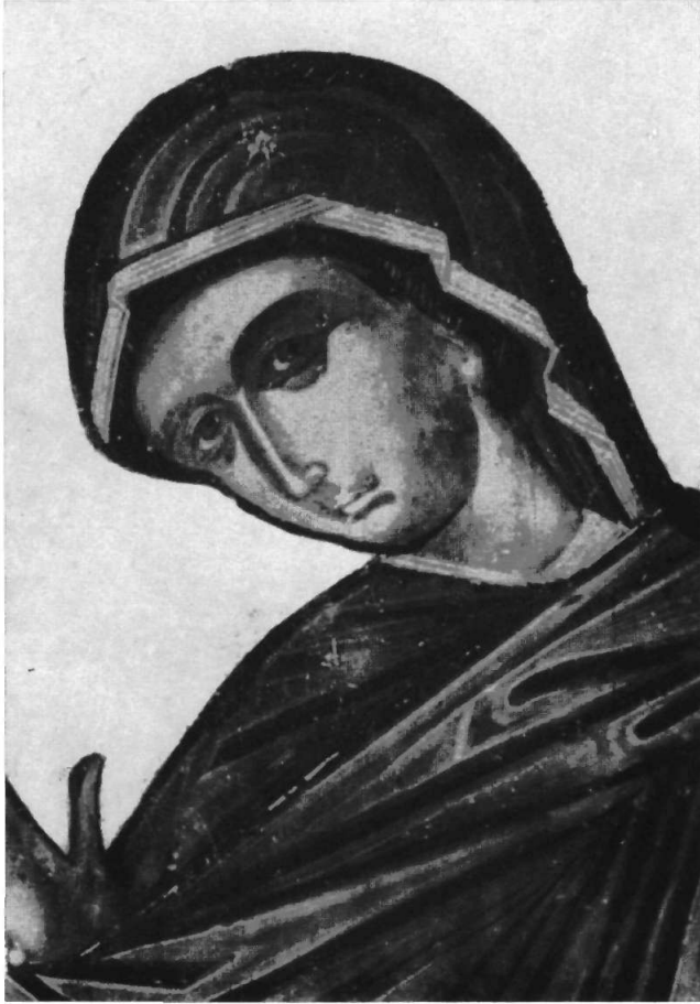
Ἡ Θεοτόκος εἰς τὸ βῆμῶθυρον τοῦ ναοῦ τῆς Ὑπαπαντῆς.