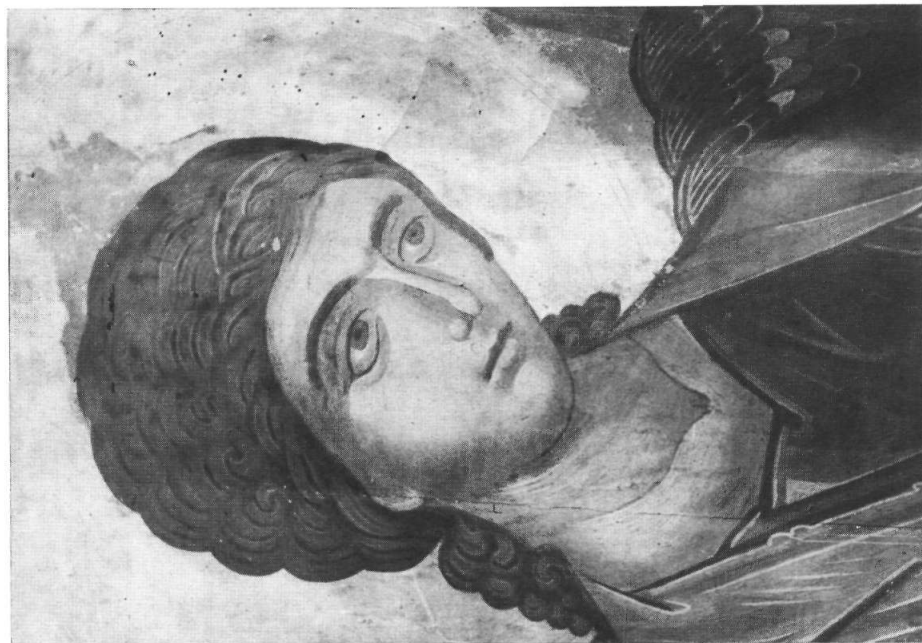
Ο Ἄρχ. Μιχαήλ καὶ ἡ Θεοτόκος ἐπὶ εἰκότων εἰς τὸν ναὸν τοῦ Προπάτου τῶν Καρῶν Ἁγίου Ὁρους. (Δεπτομέρεια).