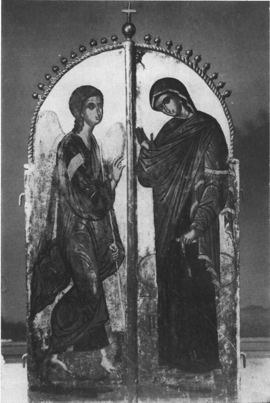
Θεσσαλονίκη. Ναός τῆς Ὑπαπαντῆς. Βημόθυρον εἰς τὸ τέμπλον.