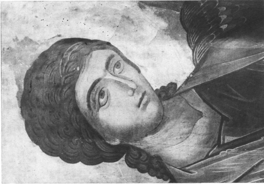
Ὁ Ἄρχ. Μιχαήλ καὶ ἡ Θεοτόκος ἐπὶ εἰκότων εἰς τὸν ναὸν τοῦ Προπάτου τῶν Καρυῶν Ἁγίου Ὁρους. (Δεπτομέρεια).