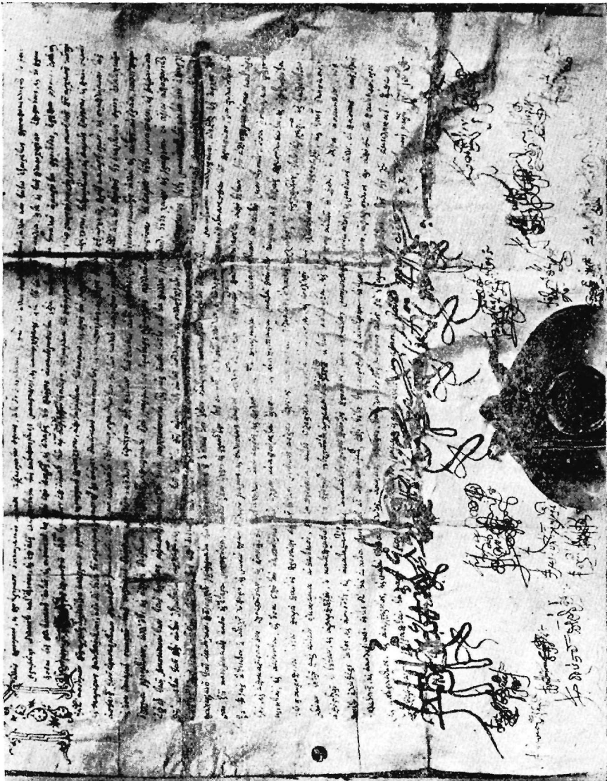
Σιγίλλιον Διονυσίου τοῦ Δ' ἔτ. 1676