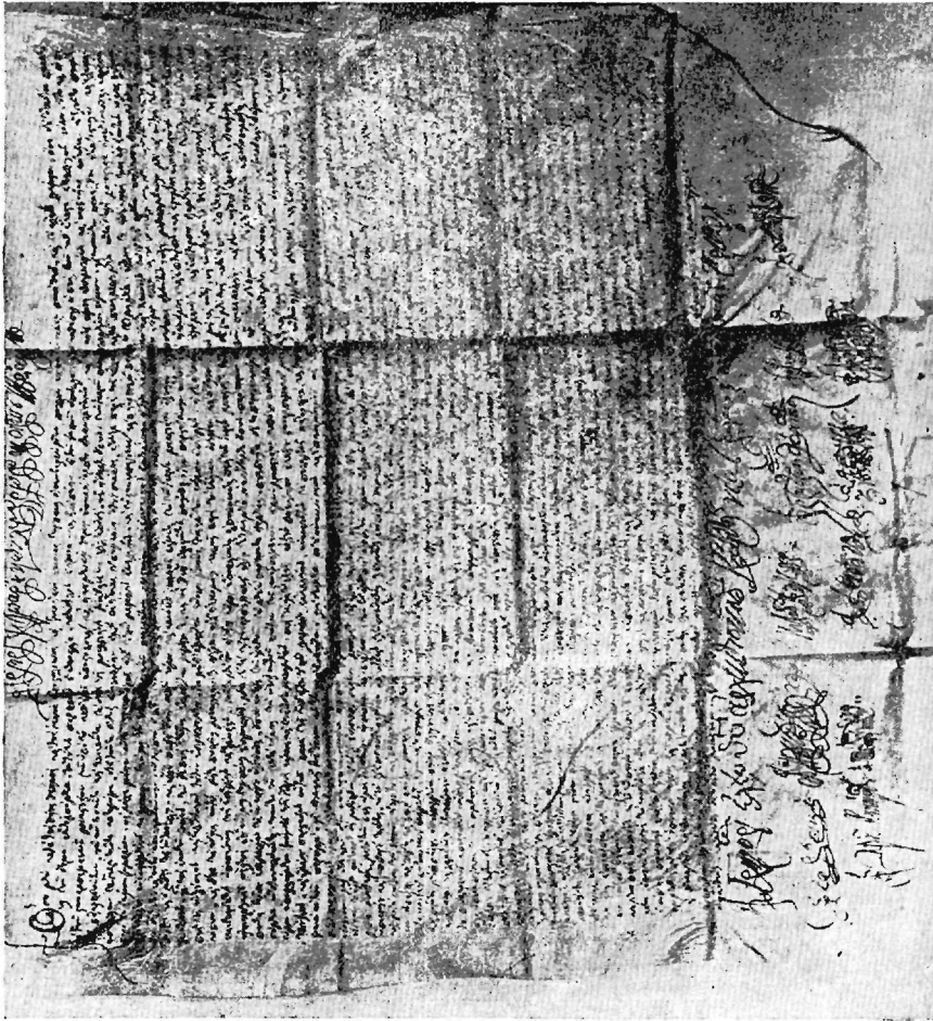
Σιγίλλιον Γρηγορίου τοῦ Ε' ἔτ. 1798

τριαρχικά σιγίλλια, ἐκδοθέντα διὰ τὴν αὐτὴν Μονὴν ὑπὸ τῶν πατριαρχῶν Σεραφεῖμ Β' (1761) καὶ Νεοφύτου Ζ' (1794).