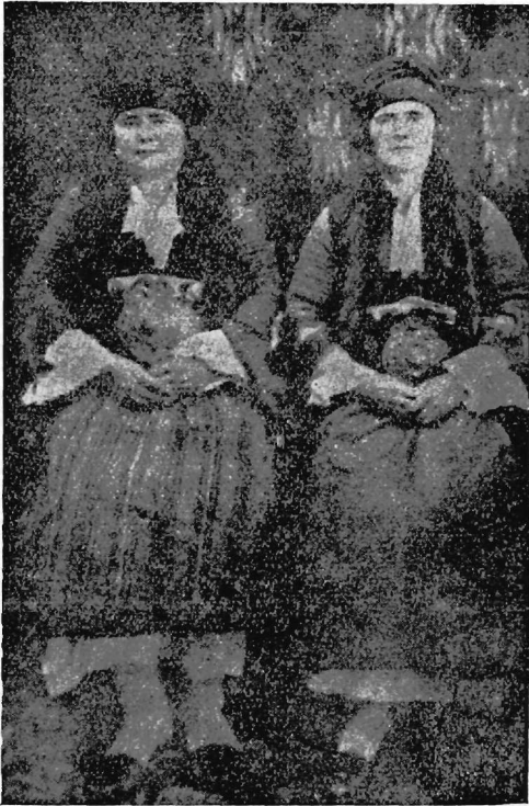
Εἰκ. 3. Γυναῖκες τοῦ Βογατσικοῦ μετὰ τὰς παλαιὰς ἐνδυμασίας των.

Ἐφ' ὅσον λοιπὸν ἐκ τῆς ἐκλογῆς τῶν μελλονύμφων ἐξαρτᾶται ἡ εὐτυ- χία καὶ εὐδαιμονία οὐχὶ μόνον τῶν συζευγνυμένων, ἀλλὰ καὶ αὐτῶν τῶν τέ-