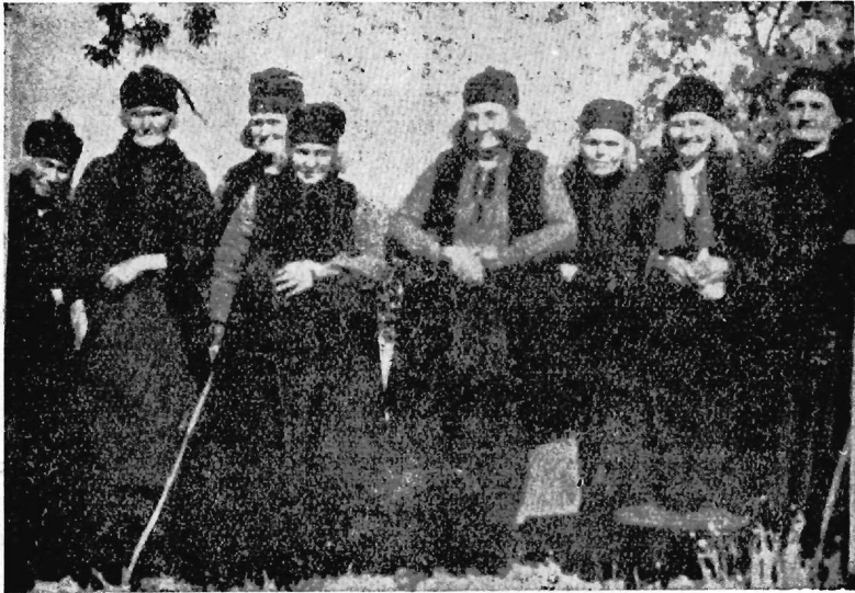
Εἰκ. 2. Γυναῖκες τοῦ Βογατσικοῦ μὲ τὰς παλαιὰς ἐνδυμασίας των.

Σήμερον ἐξέλιπον ὅλα ἐκεῖνα τὰ ἀγὰ καὶ συγκινητικὰ ἔθιμα. Αἱ σχετικαὶ συνθήκαι ἐκ βάθρων ἤλλαξαν. Οἱ περισσότεροὶ τῶν ἀποδημούντων Βογατσιωτῶν παραλαμβάνουν μαζί των καὶ τὰς οἰκογενεῖας των, μονίμως πλέον ἐγκαθιστάμενοι ἐν τῇ ξένη. Μόνον κατ' ἀραιὰ χρονικὰ διαστήματα καὶ δι' ὀλίγον μόνον χρόνον ἐπισκέπτονται, χάριν ἀναψυχῆς καὶ πρὸς ἱκανοποίησιν τοῦ νοσταλγικοῦ των αἰσθήματος, τὴν ἰδιαιτέραν πατρίδα των. Ἐν τούτοις, καὶ ἐν τῇ ξένη ζῶντες οἱ Βογατσιῶται, δὲν λησμονοῦν τὴν γενέτειράν των,