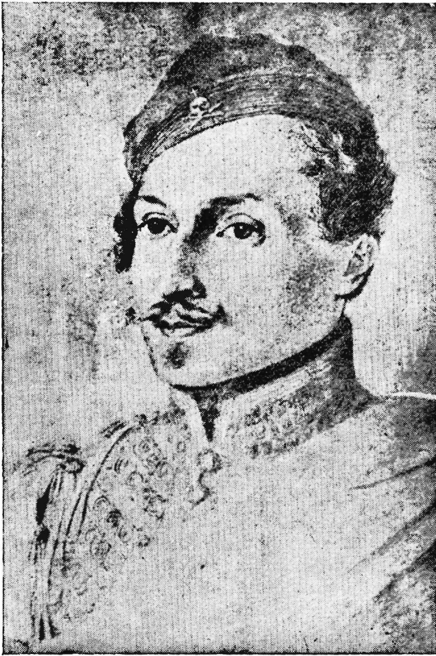
Γεώργιος Λασσάνης Φιλικός (1793 — 1870)

Ἀντίγραφον ἐκ τῆς μοναδικῆς εἰκόνας, τῆς ἐναποκειμένης ἐν τῷ Μουσείῳ τῆς Ἱστορικῆς καὶ Ἐθνολογικῆς Ἑταιρείας, παραχωρηθὲν εὐγενῶς ὑπ' αὐτῆς εἰς τὸν συγγραφέα.