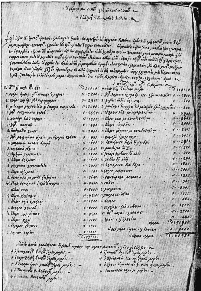
Προικοσύμφωνον ἐκ Κοζάνης τοῦ 1796

Και εις τὸ προικοσύμφωνον τοῦτο γίνεται χρῆσις τοῦ ἐκτενεστέρου τύπου διὰ τὸ κυρίως κείμενον. Σημασίαν ἔχει μεγάλην ἰδίως ἡ λεπτομερῆς καταγραφή τῶν ἀντικειμένων τῆς προικὸς μετὰ τῆς ἀναγραφῆς τῆς ἀντιστοίχου ἀξίως ἐκάστου αὐτῶν. Διὰ τὴν οικονομικὴν κατάστασιν τῆς ἐποχῆς ἐκεί-