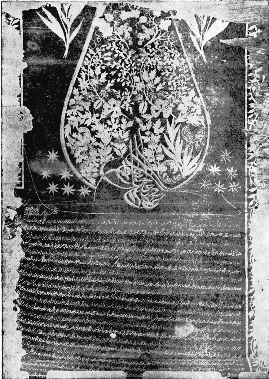
Φερμάνιον Μαχμούτ Β' έτ. 1824