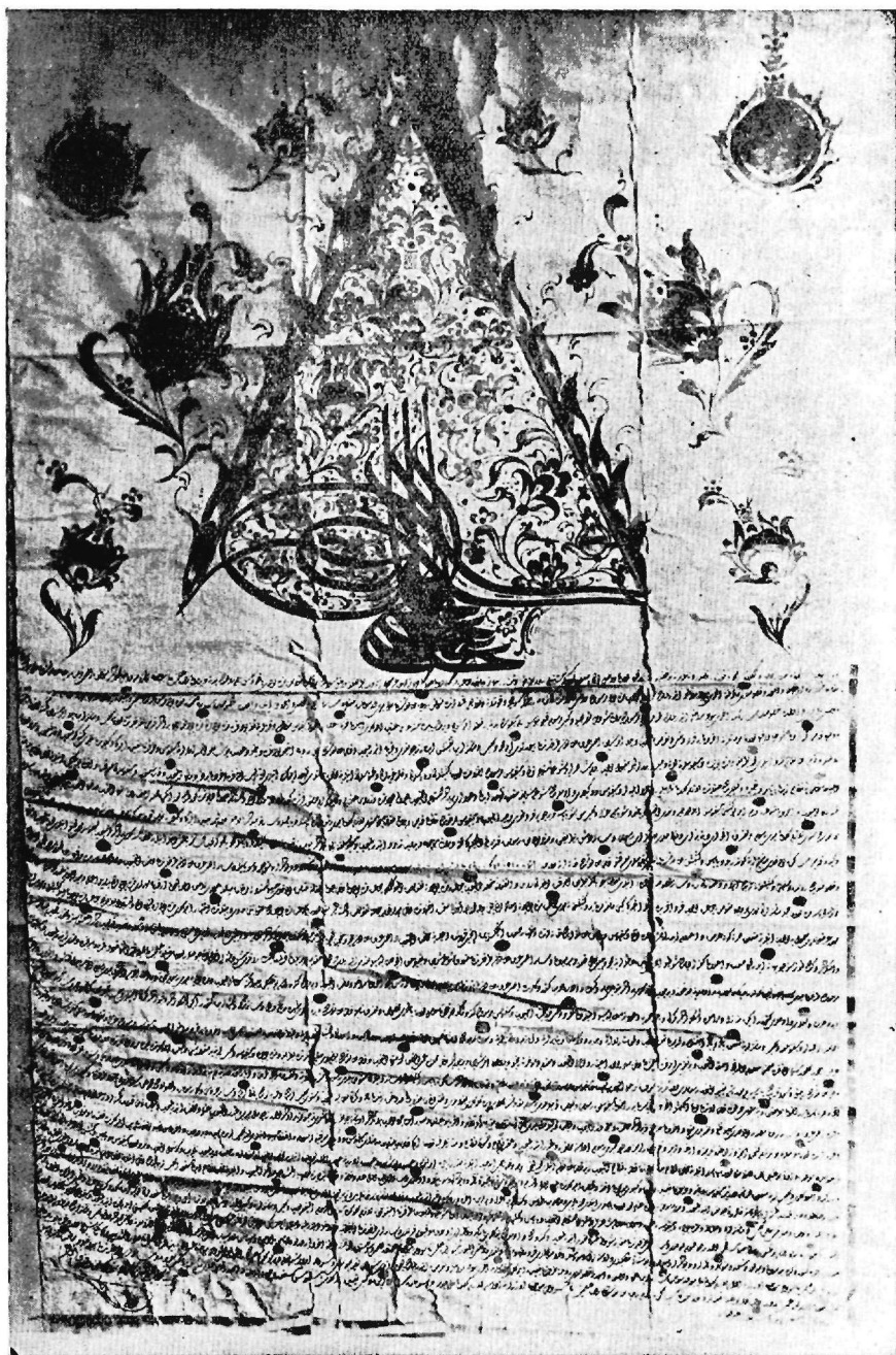
Φερμάνιον Σελίμ Χαμίτ έτ. 1785 ( ; )