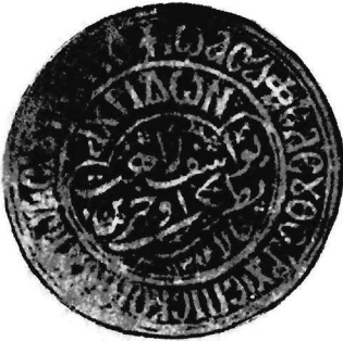
Εικ. 4. Σφραγίς Ἀρχιεπισκόπου Ἀχρίδος Ἰωάσαφ