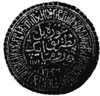
Εικ. 5. Σφραγίς Ἀρχιεπισκόπου Ἰπεκίου Γαβριήλ