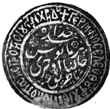
Εικ. 2. Σφραγίς Ἀρχιεπισκόπου Ἀχρίδος Γερμανοῦ