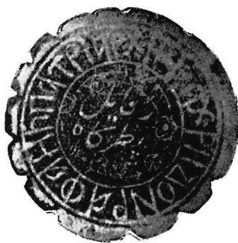
Εικ. 3. Σφραγίς Ἀρχιεπισκόπου Ἀχρίδος Ραφαήλ