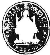
Εἰκ. 1. Ἐκ τοῦ κώδικος τῆς Κοινότητος Κλεισούρας. Θεώρησις λογαριασμῶν.

Αἱ σελ. 24-39 περιέχουν ὀνομαστικὸν κατάλογον τῶν μετὰ τὸ ἔτος 1850 συνδρομητῶν τῶν σχολείων Κλεισούρας. Ὡς πρόλογον τοῦ καταλόγου τούτου συναντῶμεν ἐν σελ. 23 τὸν ἑξῆς·