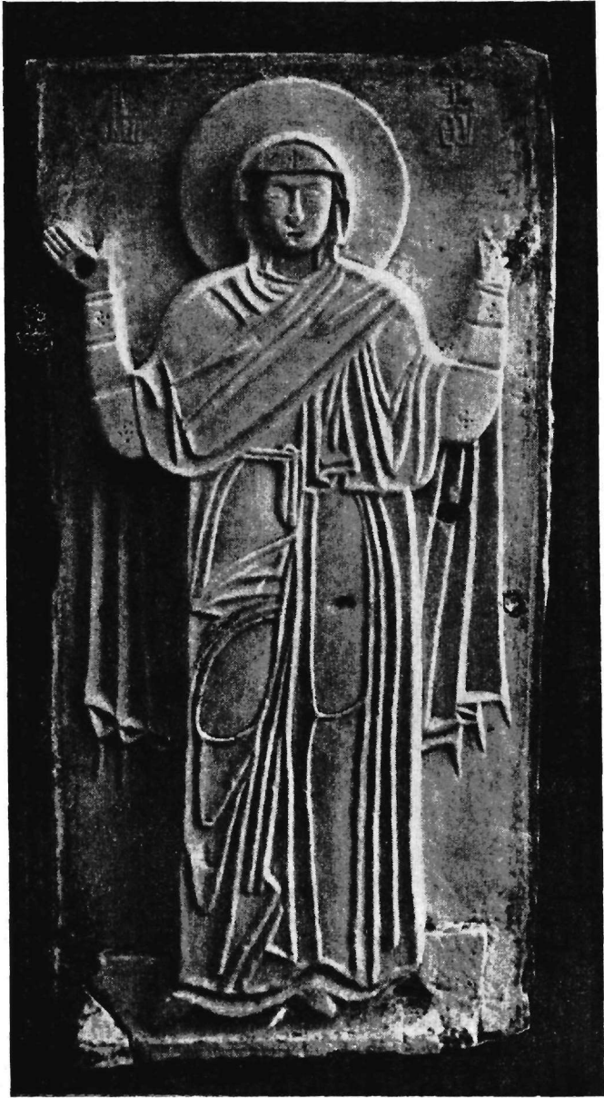
Ἀνάγλυφον τῆς δεομένης Θεοτόκου ἐκ Θεσσαλονίκης.