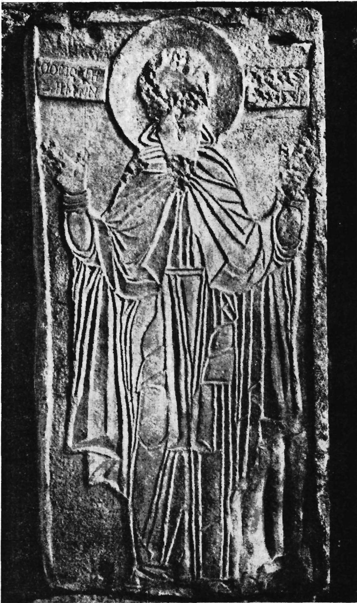
Ἀνάγλυφον τοῦ Ὁσίου Δαβίδ. Θεσσαλονίκη. Ἁγ. Γεώργιος.