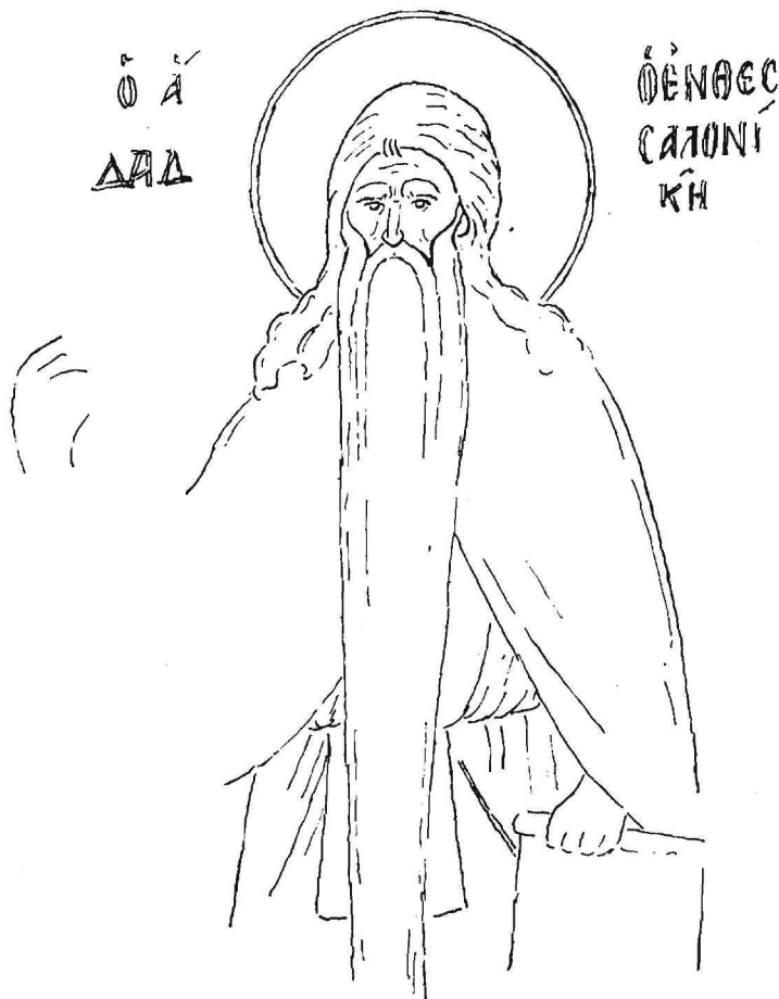
Εἰκ. 3. Τοιχογραφία τοῦ Ὁσ. Δαβὶδ εἰς τὸ Πρωτάτων Ἀγ. Ὁρους.

σις τοῦ Ὁσίου ἐπὶ τοῦ δένδρου σχετίζεται μετὰ τὴν ἐπὶ τῆς ἀμυγδαλῆς τριετῆ παραιμονήν του, περὶ τῆς ὁποίας γίνεται λόγος εἰς τὸν ἐκτεταμένον βίον του, εἰς τὸν Συναξαριστὴν, καθὼς καὶ εἰς τὸ Μηναιόν. 1