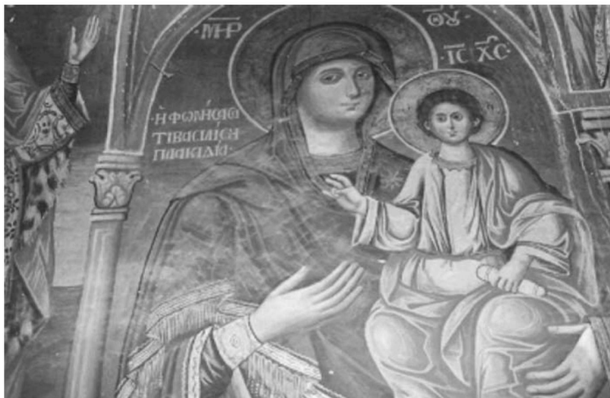
Εικ. 27. Μονή Βατοπαιδίου. Αντίγραφο της Παναγίας Αντιφωνήτριας. 19ος αι.