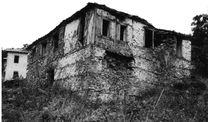
Εικ. 4. Δημοτικό σχολείο Άνω Σκοτίνας (φωτ. 1983).