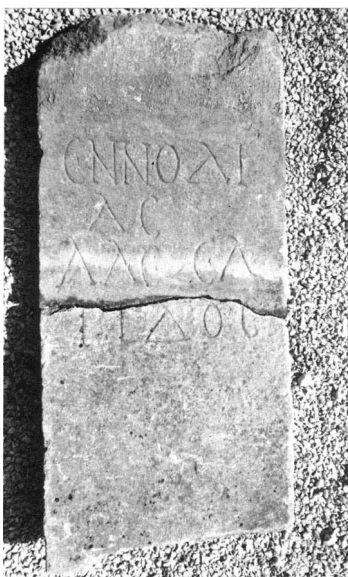
Εικ. 3. Μαρμάρινη στήλη αφιερωμένη στην Εν(ν)οδία Αλεξαίτιδα από τη Λάρισα (α΄ μισό 3ου αι. μ.Χ.).

γραφή των Φερών 15 (β΄ μισό του 2ου αι. π.Χ.), ήταν μια κουροτρόφος θεότητα, προστάτιδα των κοριτσιών, των παιδιών και γενικότερα των γυναικών 16 .