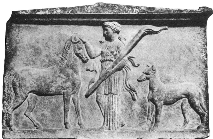
Εικ. 4. Η έφιππη φωσφόρος Εν(ν)οδία σε στατήρα των Φερών (378-370 π.Χ.).

της, είχε ισχυρή λατρεία και παράλληλα η διαπίστωση της παντελούς σχεδόν απουσίας της λατρείας της Εκάτης στις περιοχές αυτές, οδηγούν στην άποψη ότι η Εν(ν)οδία παραστάθηκε και ως τρίμορφη από τα ελληνιστικά χρόνια 22 . Η θεά στη Θεσσαλία σχετίστηκε στη λατρεία με το Δία, με τον Ποσειδώνα, τη Δήμητρα, την Άρτεμη των Φερών, με τον Απόλλωνα και τις Μοίρες, καθώς και με τον Ερμή 23 . Από τη θεοκρασία της με την πανελλήνια θεά Άρτεμη δημιουργήθηκε στις Φερές η λατρεία της Άρτεμης των Φερών —Άρτεμης Φεραίας— Άρτεμης Εν(ν)οδίας, που η μέχρι τώρα έρευνα ταύτιζε με την Εν(ν)οδία 24 . Η λατρεία αυτή διαδόθηκε εκτός Φερών ήδη από τα προκλασικά χρόνια. Μαρτυρείται επιγραφικά και αρχαιολογικά στην υπόλοιπη Θεσσαλία (Δημητριάδα, Φθιώτιδες Θήβες, Κραννώνα, Λάρισα, Αζωρο), στη νότια Ελλάδα (Οπούντας, Σικυώνα, Άργος, Νεμέα, Επίδαυρος), στην Αίγυπτο (Κόπτος), στη Μεγάλη Ελλάδα (Συρακούσες) και στην αποικία των Συρακουσών Ίσσα, στο ομώνυμο νησί της Αδριατικής. Η Εν(ν)οδία (εκτός Θεσσαλίας) συσχετίστηκε με την Εκάτη και έτσι δημιουργήθηκε η λατρεία της Ενοδίας Εκά-