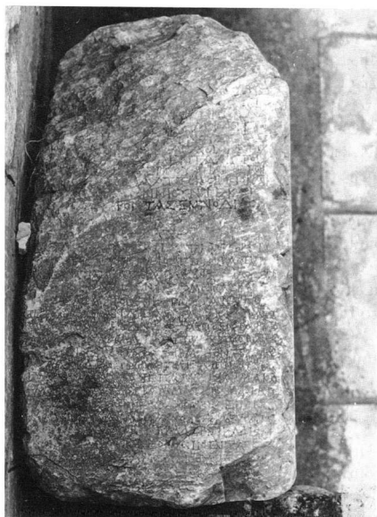
Εικ. 1. Μαρμάρινη λιθόπλινθος από το μεγάλο ιερό της Εν(ν)οδίας στις Φερές (α' μισό 2ου αι. π.Χ.).