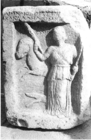
Εικ. 7. Μαρμάρινη ανάγλυφη αναθηματική στήλη από την Πτολεμαίδα (πιθανότατα από την Εξοχή) με παράσταση όρθιας δαδοφόρου Εν(ν)οδίας με άλογο και σκυλί (πριν από τα μέσα του 2ου αι. π.Χ.).