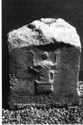
Εικ. 8. Μαρμάρινος ανάγλυφος ελληνιστικός βωμός από τη Λητή, που παριστάνει ξόανο δαδοφόρου θεάς με σκυλί.