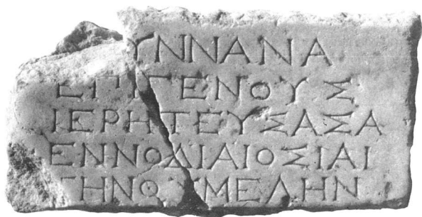
Εικ. 2. Μαρμάρινη πλάκα εντοιχισμένη σε θυμέλη ιερού της Εν(ν)οδίας Οσίας στη Βέροια (β' τέταρτο 3ου αι. π.Χ.).