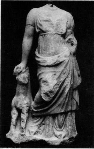
Εικ. 9. Μαρμάρινο ελληνιστικό αγαλμάτιο όρθιας θεάς με σκυλί από την Πέλλα.