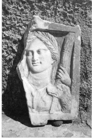
Εικ. 6. Μαρμάρινο ανάγλυφο της Εν(ν)οδίας με σκυλί από τη Λάρισα (4ος αι. π.Χ.).

της, η οποία είναι γνωστή μόνο φιλολογικά στην Αθήνα 25 και στη Ρώμη 26 . Η Ενοδία Εκάτη δεν διαπιστώνεται επιγραφικά στη λατρεία, αλλά ούτε μπορεί να διακριθεί εικονογραφικά στην τέχνη. Η Εκάτη με την προσωνομία Ενοδία 27 είναι γνωστή στο Άργος, στην Αίγινα, στην Κολοφώνα, στην Έφεσο, στο Βυζάντιο και στη Λάρδο της Ρόδου 28 . Οι παραπάνω λατρείες, που χρονολογούνται από την υστεροελληνιστική εποχή και μετά, δεν φαίνεται να σχετίζονται άμεσα με τη θεσσαλική θεά Εν(ν)οδία. Η θεά αυτή των Φερών παρέμεινε αυτοτελής τουλάχιστον στη Θεσσαλία και τη Μακεδονία έως και την ύστερη αρχαιότητα.