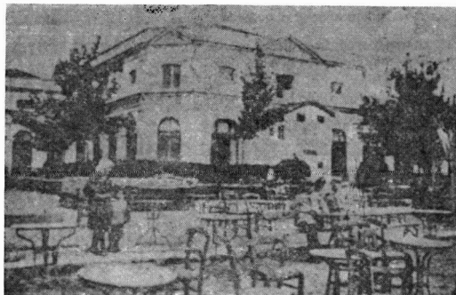
Εικ. 4. Το θέατρο του Λευκού Πύργου από τη ΝΑ πλευρά.

να τις παρακάμψει κανείς. Επίσης το λιθόστρωτο ήταν κακοστρωμένο και γεμάτο λακκούβες. Και να σκεφθεί κανείς ότι με τα κάρα των 8 βοδιών θα έπρεπε να περάσει κανείς όλα τα παζάρια και ν' αποφύγει γωνιακά μαγαζιά και δρόμους ακάθαρτους που δεν τους σκούπιζαν, δρόμους γεμάτους ψοφίμια που σάπιζαν. Τελικά —έστω και με πολλούς κόπους και αγωνίες— οι αρχαιότητες φθάνουν στο λιμάνι.