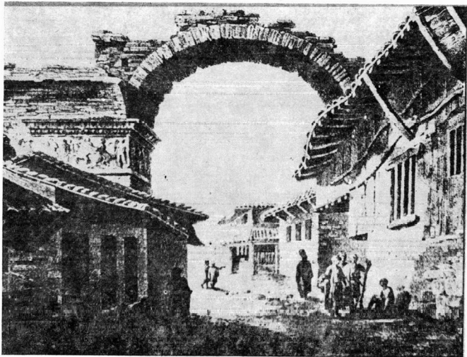
Εικ. 2. Το θριαμβικό τόξο του Γαλερίου.

Τώρα βρίσκομαι σε αβεβαιότητα. Μολονότι έγραψα στο Παρίσι ότι είναι αδύνατο να ξεσηκώσουμε όλο το μνημείο, επειδή δεν έχουμε τα αναγκαία μηχανήματα, εντούτοις θα κάνω μια δοκιμή. Από αύριο θα ιδώ, αν υπάρχει τρόπος να πριονίσω τον θριγκό, επάνω στον οποίο τοποθετούν τα αγάλματα και ο οποίος αποτελείται από φοβερούς όγκους. Αφού όμως έκανα τόσες θυσίες, θα προχωρήσω ως τα άκρα... Αλλιώς δεν θα πάρω παρά μόνο τα αγάλματα και ελπίζω να τελειώσω το προσεχές Σάββατο. Επομένως θα μπορέσω να ξεκινήσω για τη Γαλλία την προσεχή Τρίτη. Αλλά μην υπολογίζετε πολύ σ' αυτό.