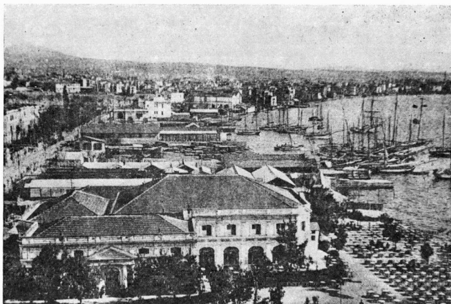
Εικ. 3. Το θέατρο του Λευκού Πύργου από τη Δ πλευρά.

θριαμβικό τόξο. 'Ο πασάς είναι πράγματι θαυμάσιος για την αφοσίωση που μου δείχνει. Δεν έχω παρά να του πω μια λέξη, και αμέσως μου στέλνει βοδάμαξες». Γι' αυτό και ο Miller λυπάται πολύ, όταν μαθαίνει ότι ο πασάς πρόκειται να εγκαταλείψει τη θέση του, έστω και αν ακόμη η είδηση αυτή δεν είναι επίσημη. Πάντως θεωρείται σχεδόν βέβαιη (σ. 342-343).